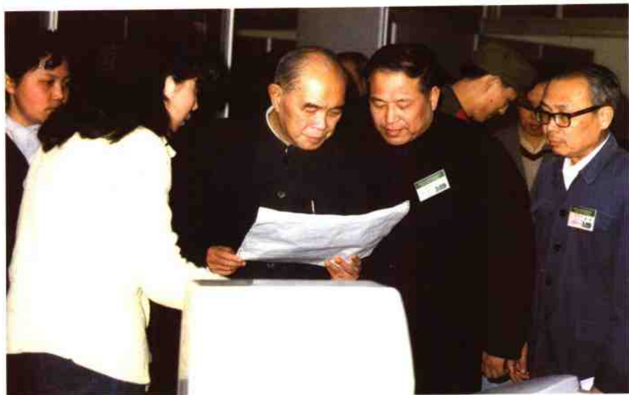
1985年4月，姚依林副总理参观“现代办公自动化技术交流会”