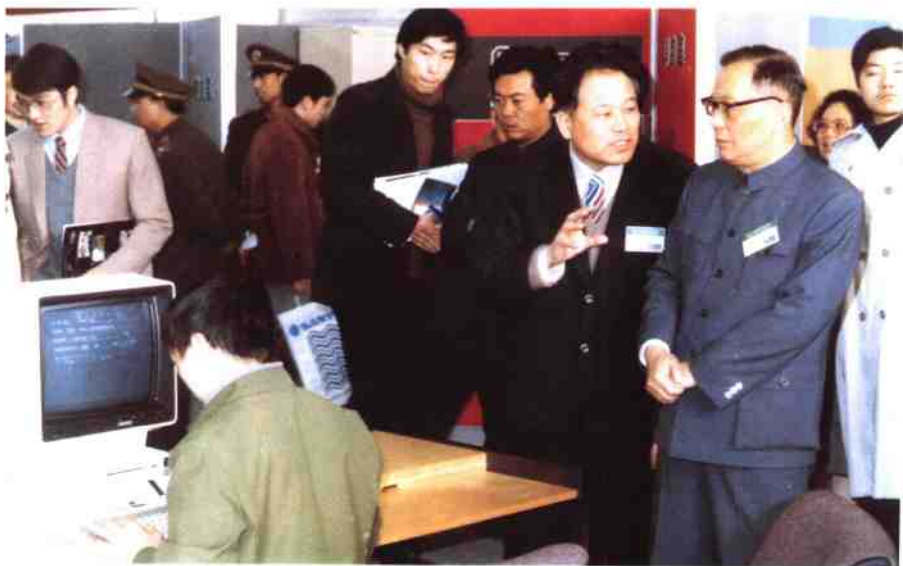
1985年3月，张劲夫副总理参观“现代办公自动化技术交流会”