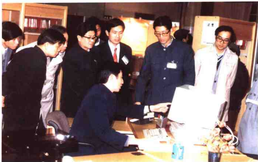
1985年3月，中共中央办公厅主任王兆国同志 参观“现代办公自动化技术交流会”