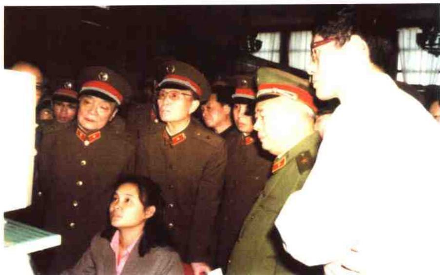
1986年5月3日，军委副主席杨尚昆等首长在军事博物馆 参观JH微机系列产品