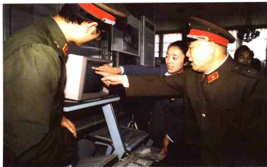
1986年5月5日，国防大学政委李德生参观在军事博物馆举办的 JH微机展示会