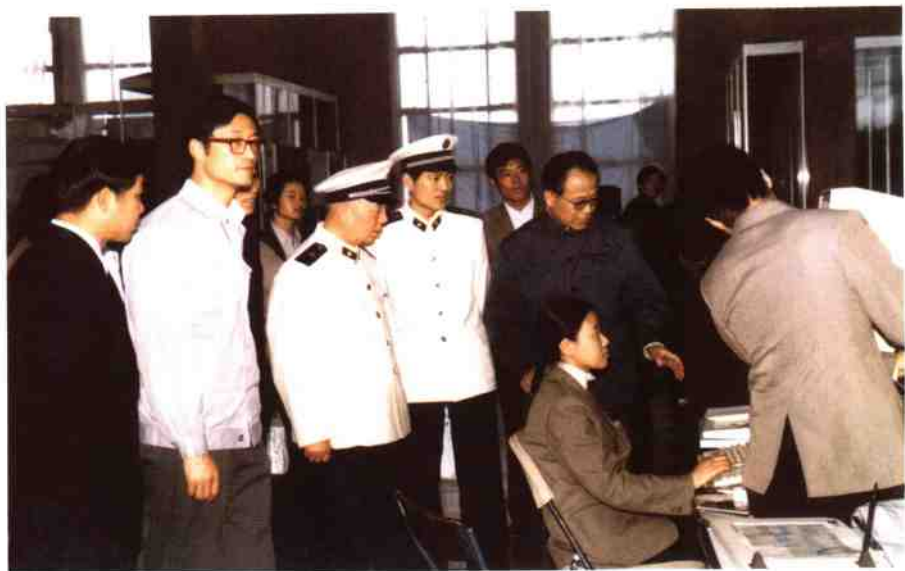
1986年5月4日，海军司令员刘华清参观在军事博物馆举办的 JH微机展示会