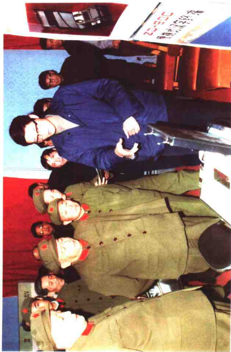
1985年1月，在晓峰公司办公自动化展示会上，杨尚昆等军委首长听取“834工程” 总设计师张翔关于JH系列微机性能的汇报