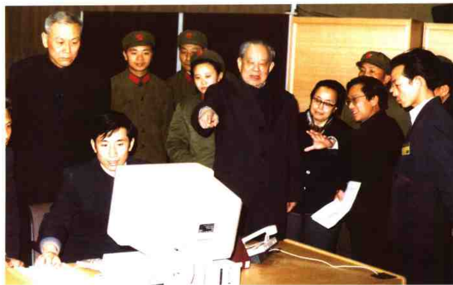
1985年4月，廖汉生参观“现代办公自动化技术交流会”