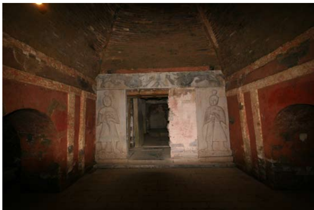
南京南唐二陵地宫内景