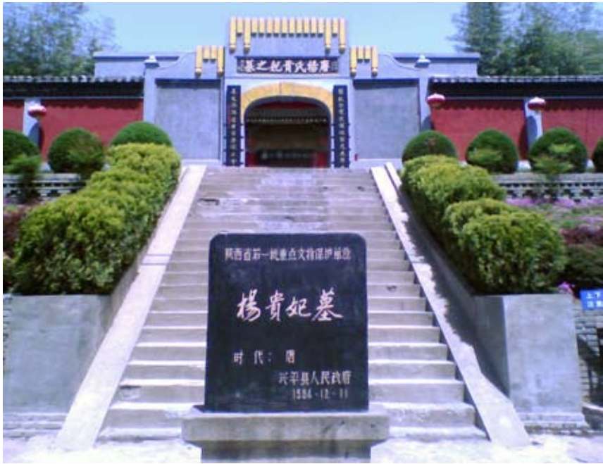
陕西兴平杨贵妃墓