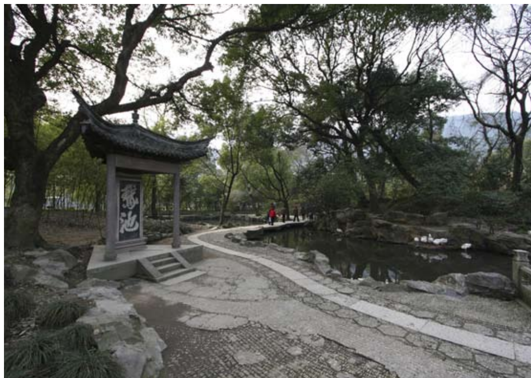
绍兴兰亭鹤池全景