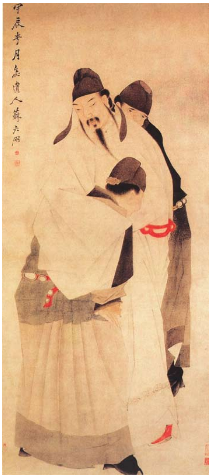
(清) 苏六朋《太白醉酒图》