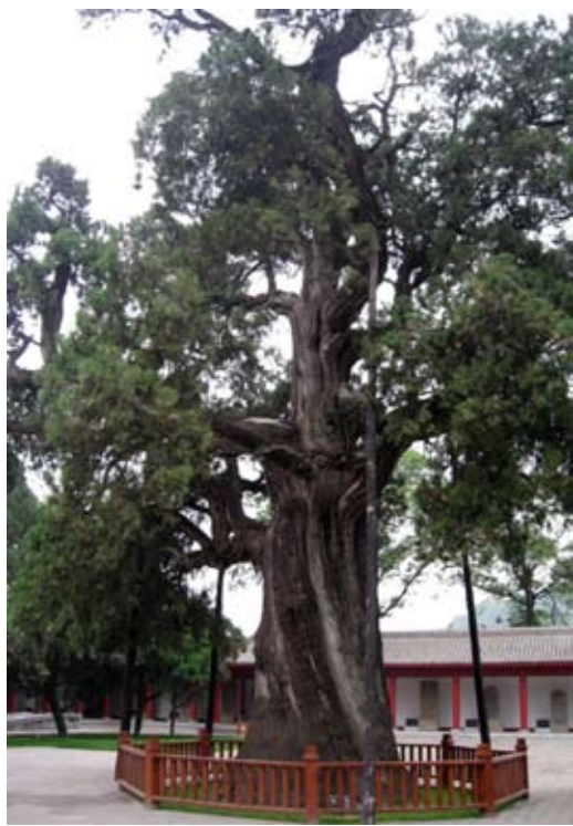
陕西黄帝陵黄帝手植柏