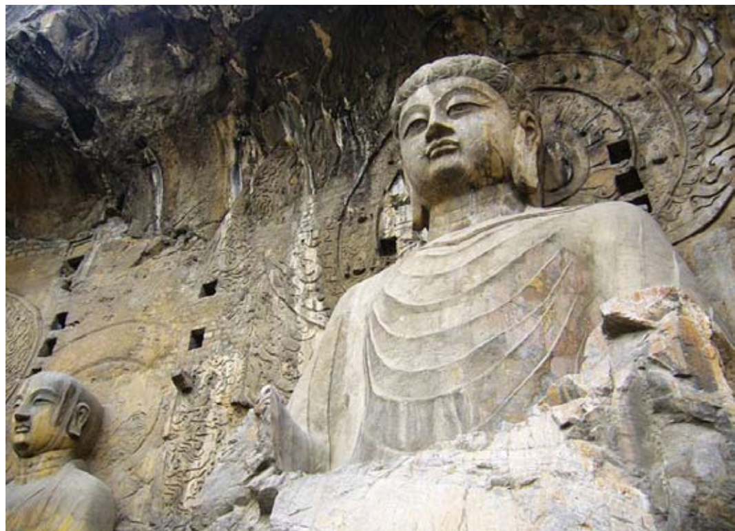
洛阳龙门卢舍那佛