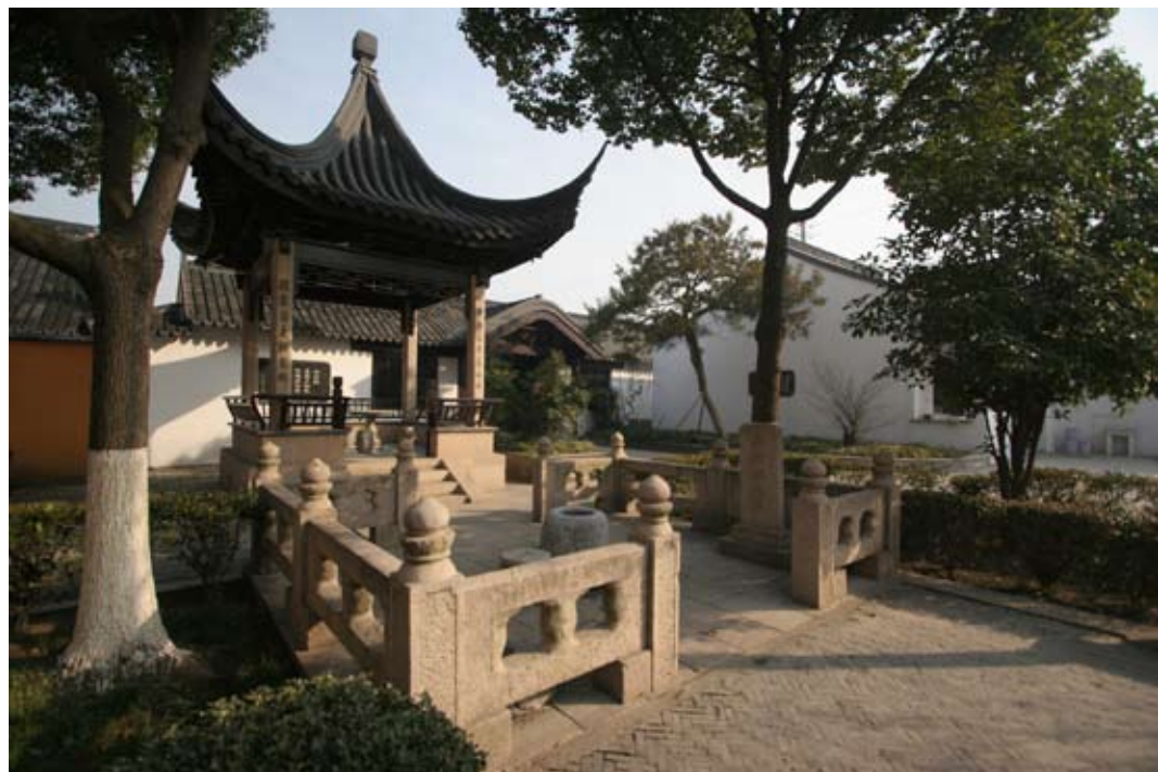
无锡梅里泰伯宅故井