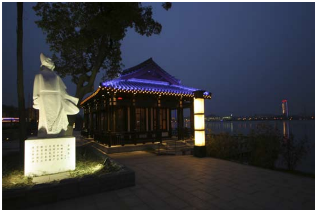
南京玄武湖李白塑像