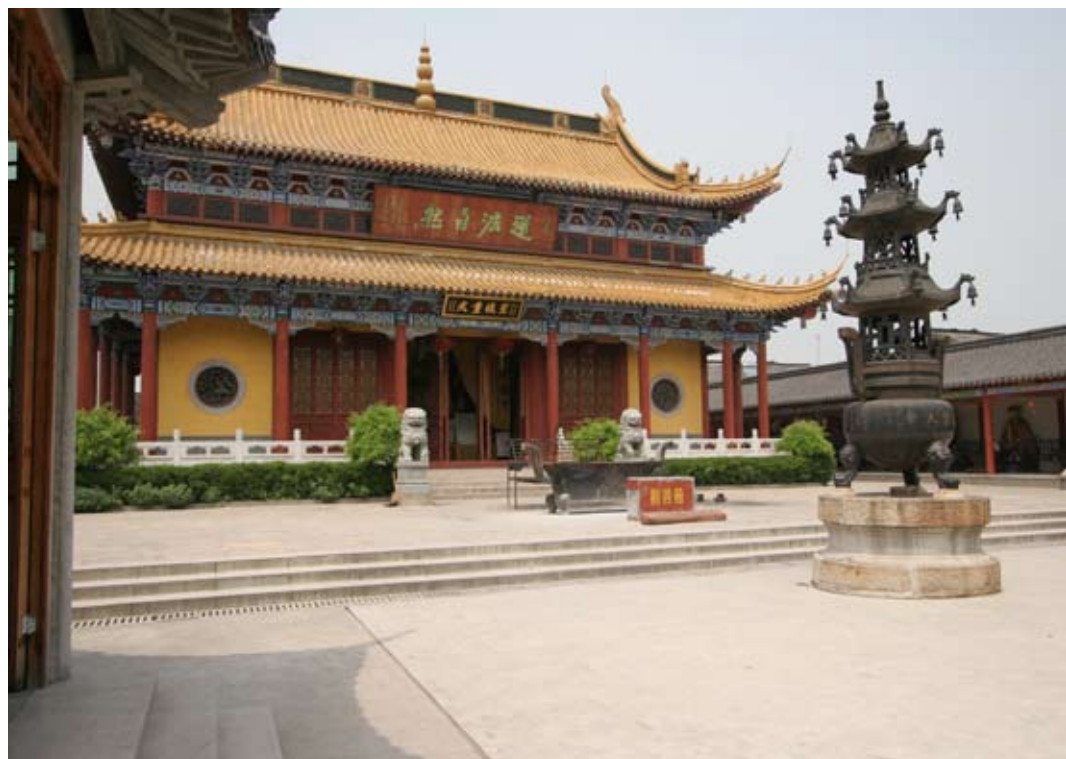
镇江丹阳季子庙大殿