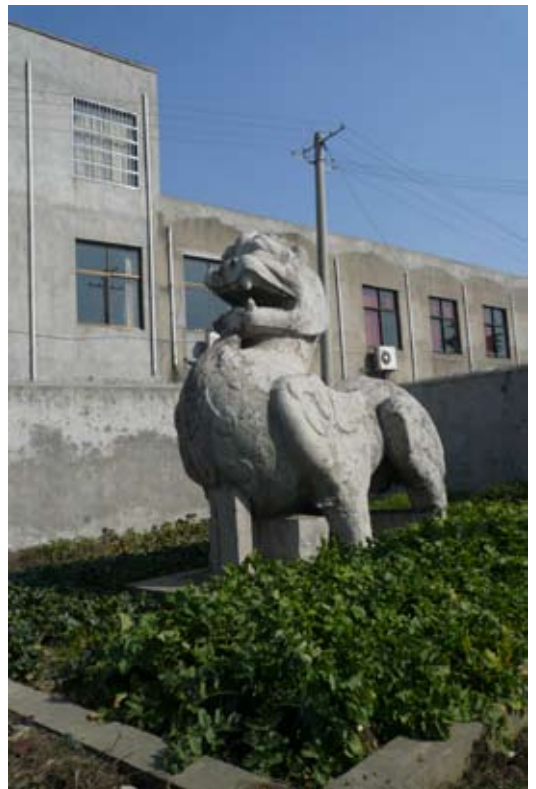
丹阳六朝陵墓石刻