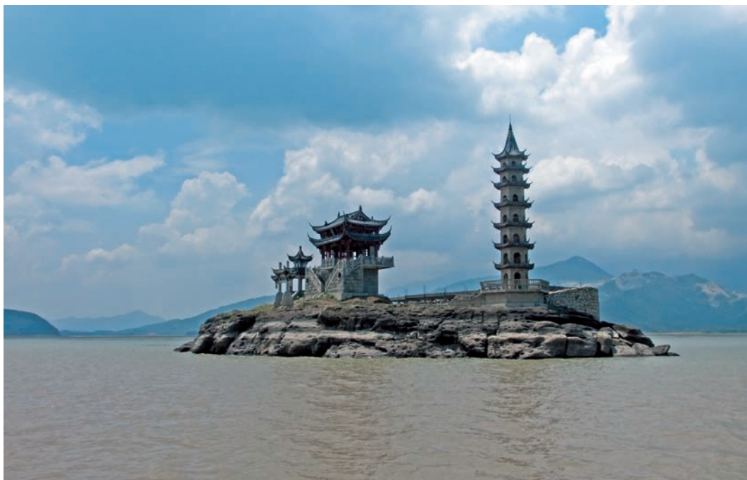
星子县鄱阳湖落星墩