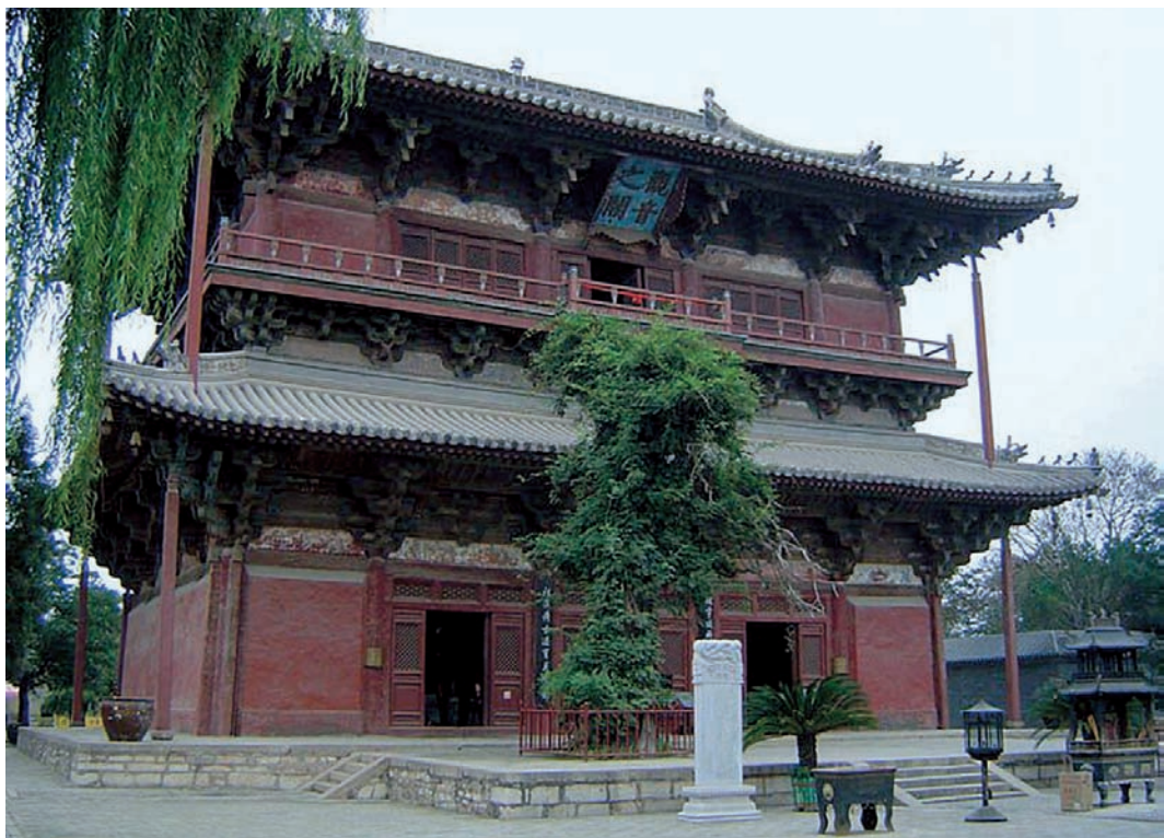
天津蓟县独乐寺观音之阁