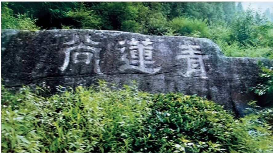
五老峰下 青蓮谷刻石