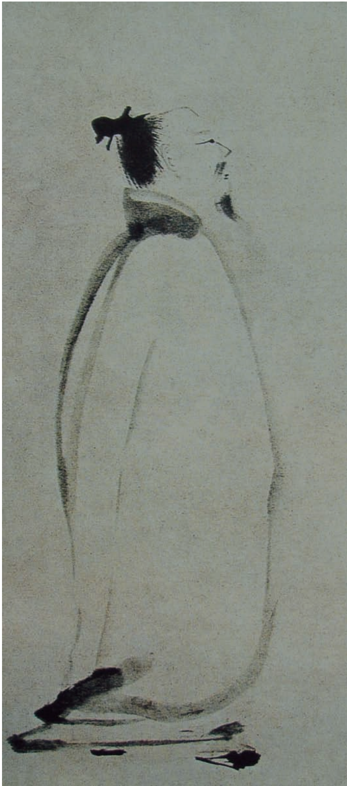
(南宋)梁楷《李白行吟图》