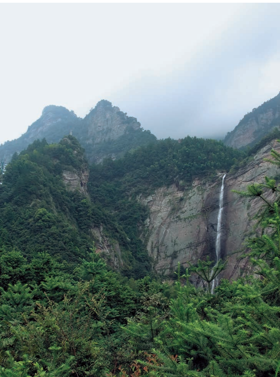
李白歌咏的庐山黄岩瀑布