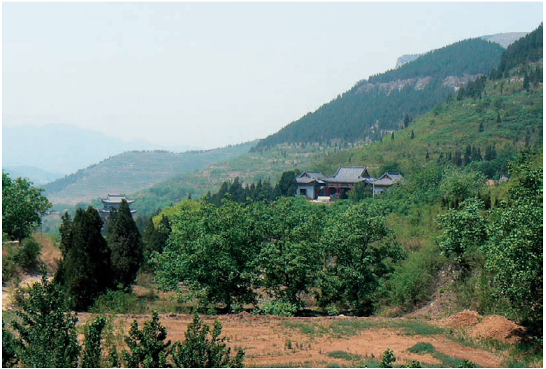
山东微山湖汉留侯张良祠墓远眺