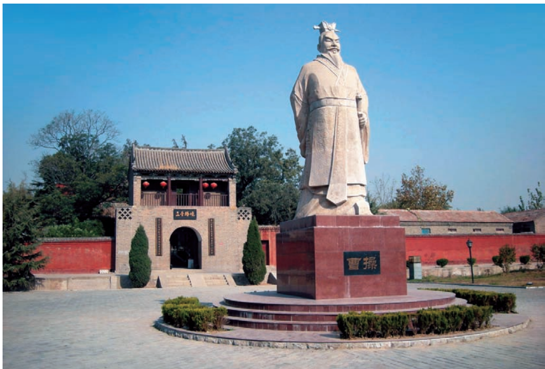
河北临漳县邺城遗址