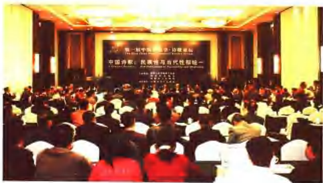
第一届中国诗歌节“诗歌论坛”会场全景