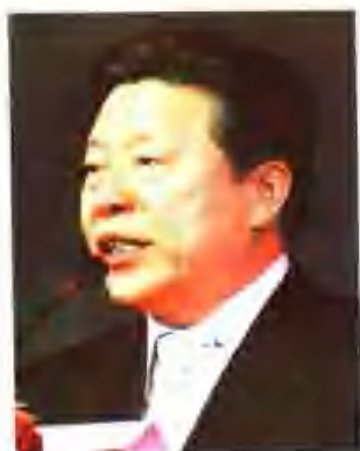
第一届中国诗歌节组委会主任。文化部部长孙家正