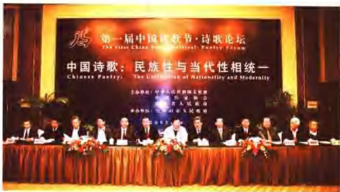
第一届中国诗歌节“诗歌论坛”开幕式主席台（从左至右：张同吾、姚玉吉、朱增泉、黄亚洲、田惟谦、王蒙山、孙黎正、郭金龙、俞炳华、丁海中、吉狄马加、孙联青、李斌）