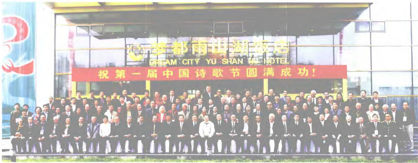
出席中国第一届中国诗歌节的有关领导与全体代表合影