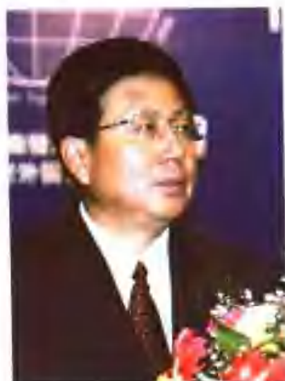
第一届中国诗歌节承办委员会名誉主任。中共马鞍山市委书记丁海中