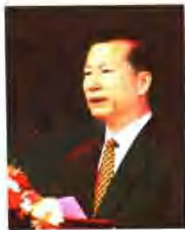
第一届中国诗歌节组委会主任。中国作协党组书记金炳华