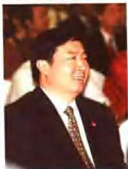
第一届中国诗歌节承办委员会主任。马鞍山市市长谢玉舟