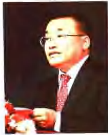
第一届中国诗歌节组委会主任。安徽省省长王金山