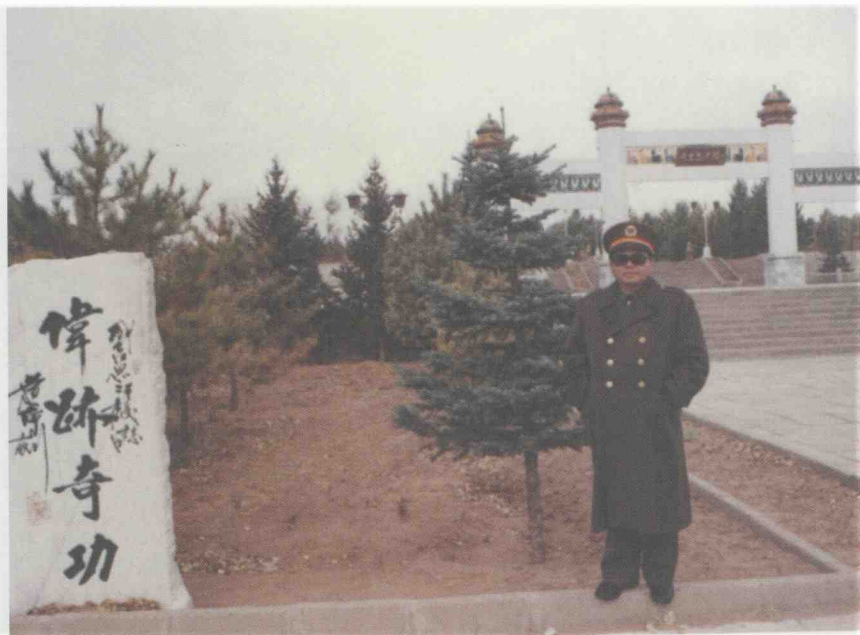
内蒙古成吉思汗陵