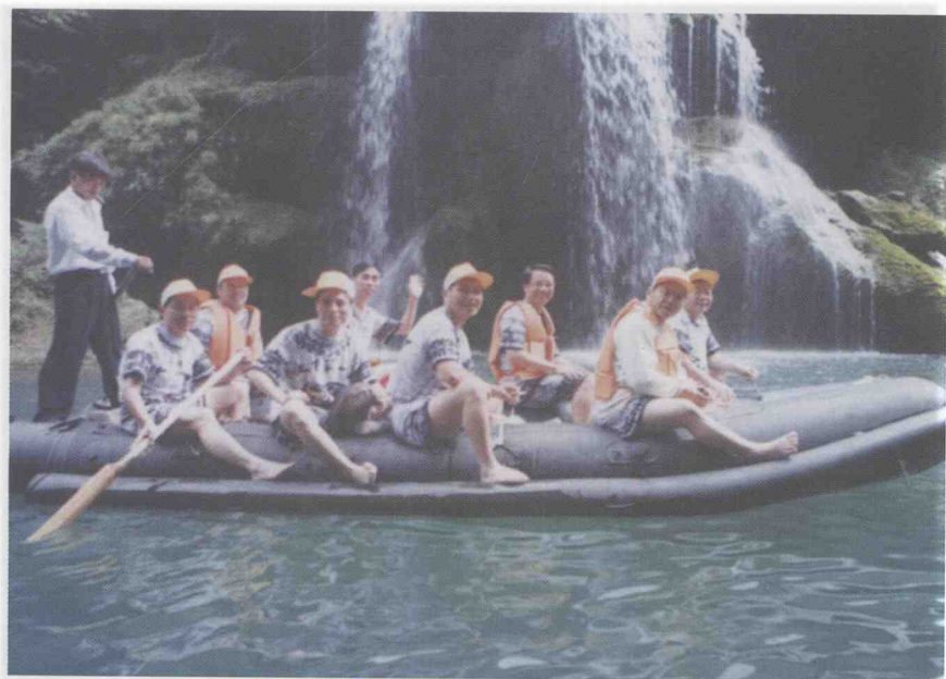
湖南吉首猛洞河漂流