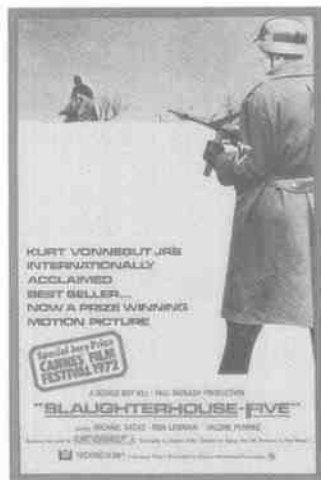
《五号屠场》电影剧照

皮鼓》里，奥斯卡的母亲只能在家分娩。这位精明能干的妇女经营着一间地窖店铺。临产的阵痛袭来时，她还在忙碌着“把糖盛到一磅和半磅装的蓝色口袋里”。格拉斯透过小奥斯卡的眼睛来观察，一只误入室内的飞蛾正在追逐两只六十瓦的灯泡。这个肉质鲜嫩的初生婴儿大哭大叫，在飞蛾的噪音和形成的巨大投影之下，“既孤独又无人理解”。而此前读者已经了解到那间黄色的卧室的布局，除去白漆衣柜、梳妆台、小屉柜、天花板上吊灯的浅玫瑰色瓷罩以外，这座“合套城堡”最引人注目的就是镶在玻璃镜框里的床头的装饰画。怀抱圣婴的马利亚在击鼓手奥斯卡的眼中，竟然成了“一个呈现肉色的正在忏悔的从良妓女”。同样，帕特里克·聚斯金德散发着迷人气息的《香水》也没有错过临产的阵痛。气味王国邪恶的天才格雷诺耶拥有一位更为低贱放纵、心狠手辣的母亲，这位患有痛风、梅毒和轻度肺结核的年轻女工当时正在巴黎的弗尔大街的鱼摊旁为早些时候掏去内脏的鲤鱼刮鱼鳞。分娩的疼痛使她的嗅觉变得迟钝。第五胎的生育和此前没有什么不一样。那团血淋淋的肉块被割断了脐带，扔弃在一堆落满苍蝇的鱼肚肠和烂鱼头中间。格雷诺耶就在宰鱼刀下侥幸地活了下来。多次杀婴的母亲却难逃斩首示