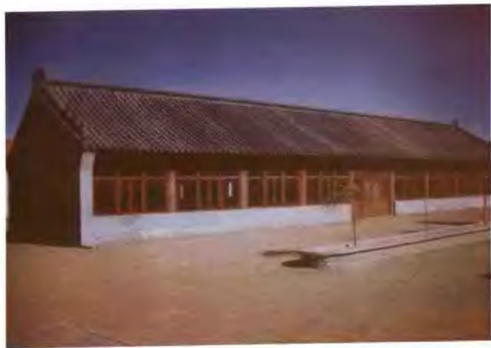
科尔沁左翼后旗吉尔嘎郎镇僧格林沁王府遗址