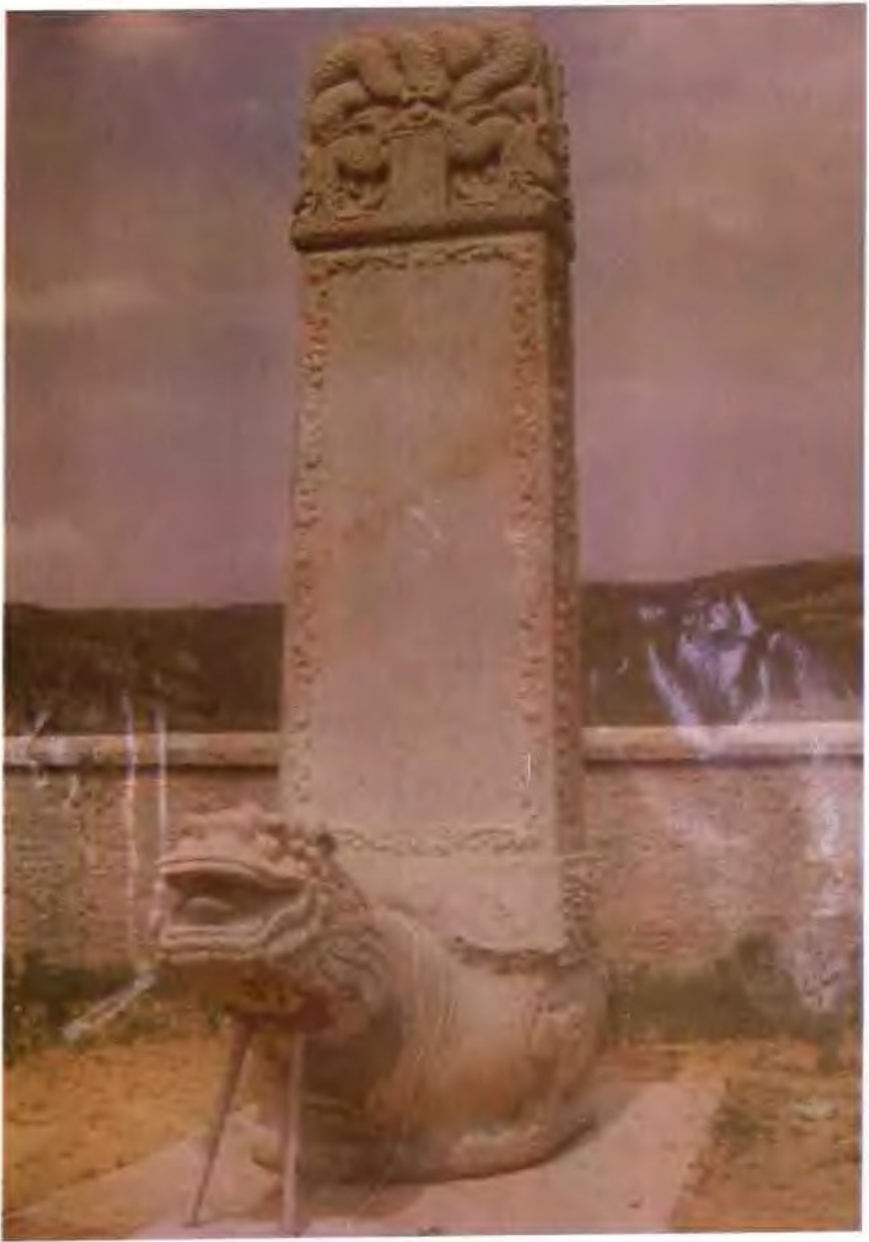
僧格林沁亲王陵寝青石盘龙碑