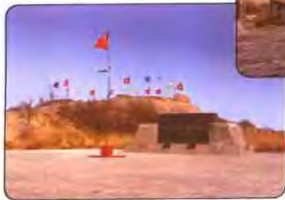
大沽口保卫战炮台遗址和清代古炮