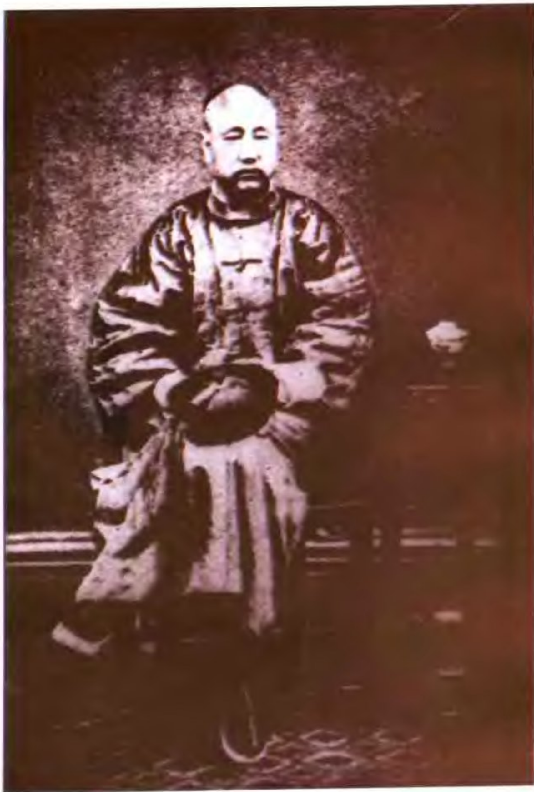
科尔沁左翼后旗札萨克、博多勒噶台亲王僧格林沁