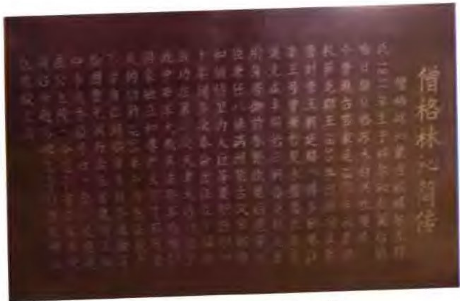
科左后旗博王府博物馆僧格林沁簡傳