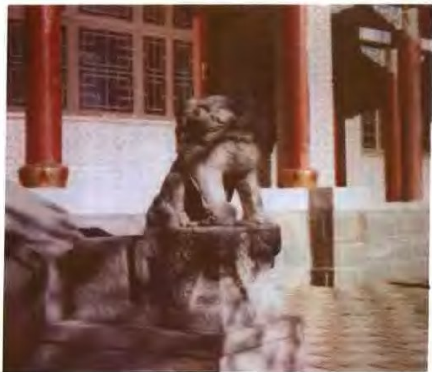
僧格林沁王府遺物——獅型門礮