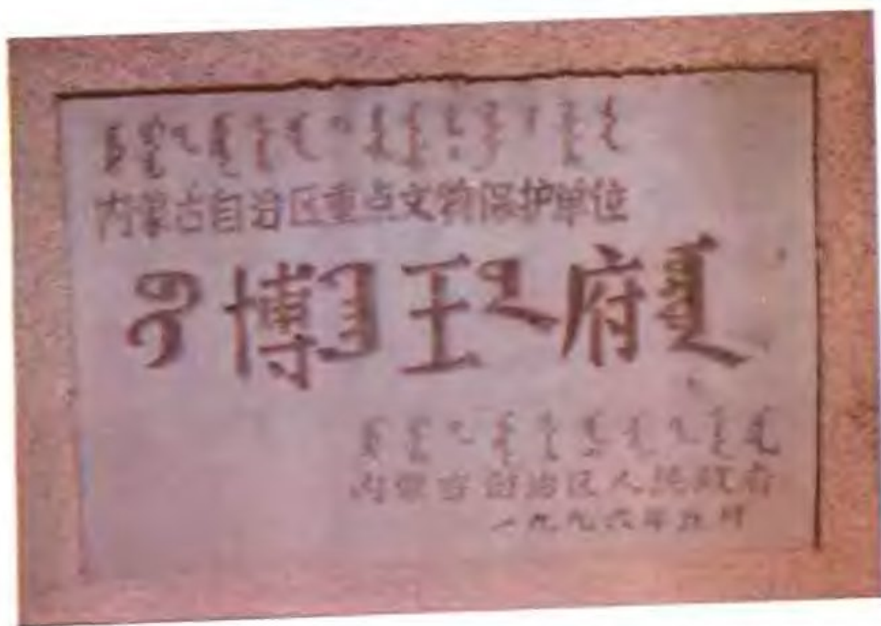
内蒙古自治区政府命名吉尔嘎郎博王府为重点文物保护单位