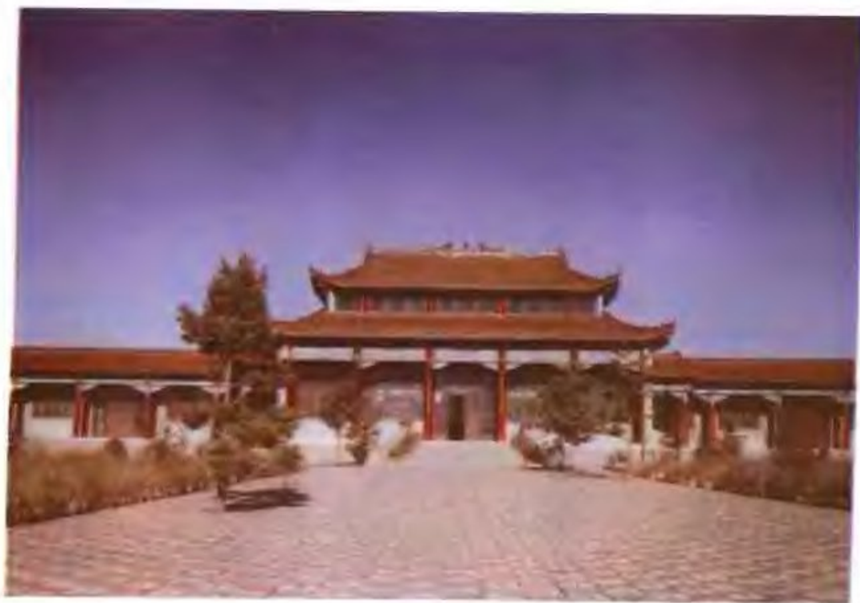
座落在科尔沁左翼后旗草原上的博王府博物馆僧格林沁铜像、正殿