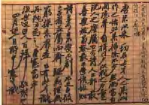
黃遵憲在陳三立《詩錄》 第四頁後頁題的跋文