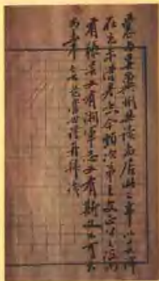
范當世在陳三立《文錄》 第一頁前頁的題署