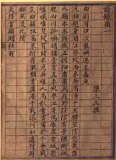
陳三立《詩錄第一》的首頁