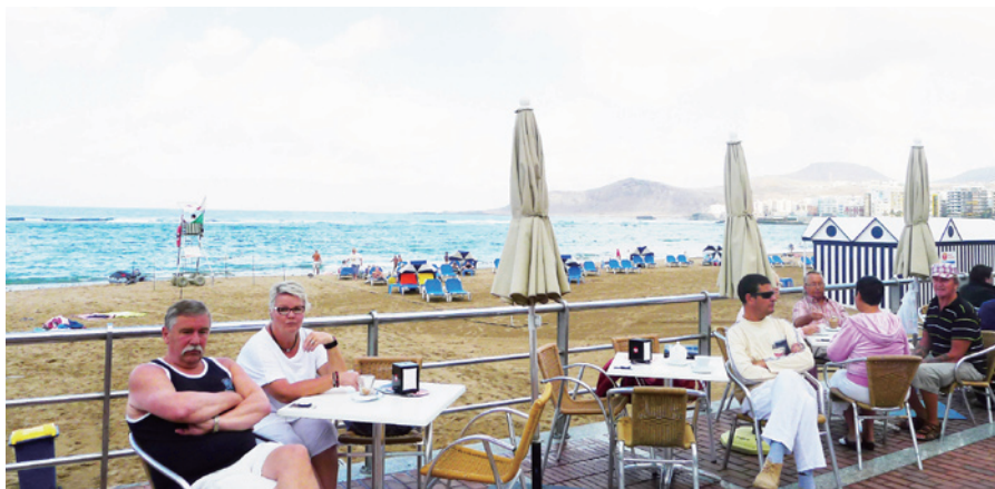
悠闲享受海滩、阳光的游客

来到玛斯帕洛玛斯 (Maspalomas) 是抵达后的第二天，这是全岛最靠近沙漠的小镇，也是各个五星级饭店的集合地。使这个小镇闻名的不是沙漠，而是风景宜人的英吉利海滩 (Playa del ingles)。这里连着沙漠，海岸线很长，大西洋的海水非常清澈，浪花也很温柔。放眼望去，只有一条笔直的海天交接线，如果这世界真的有天涯海角，这里绝对就是了。