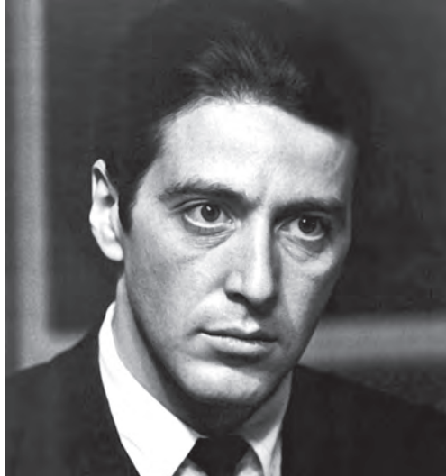
阿尔·帕西诺饰演的迈克

父》时，凯泽尔也受邀出演片中的弗雷多。此后，凯泽尔出演了科波拉执导的惊悚片《窃听大阴谋》（1974）。凯泽尔的第四个角色是在影片《热天午后》中的银行劫匪萨尔，此片为他赢得了当年金球奖最佳男配角的提名。凯泽尔的最后