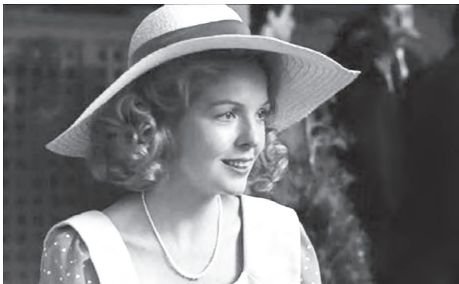
黛安娜·基顿饰演的凯

2. 弗朗西斯·福特·科波拉（Francis Ford Coppola）于1939年4月7日出生于底特律一个意大利移民家庭。童年时就混迹于剧院后台，还经常偷看父亲的演出，因此从小就对电影十分着迷。他后来就读于加利福尼亚大学洛杉矶分校影剧系，获电影硕士学位。毕业后的科波拉经常给人写剧本，但是往往被忽视，直到1970年，他因《巴顿将军》（《PATTON》）一举获得奥斯卡最佳剧本奖时，他的才能才得到了社会的承认。他和马丁·斯科塞斯、乔治·卢卡斯、史蒂文·斯皮尔伯格合称好莱坞20世纪80年代四大导演。科波拉一生以演员、导演、编剧的身份参与制作的电影无数，其导演的经典代表作有《现代启示录》《离开拉斯维加斯》《火柴人》《造雨人》《处女之死》《傀儡人生》《教父》三部曲等。