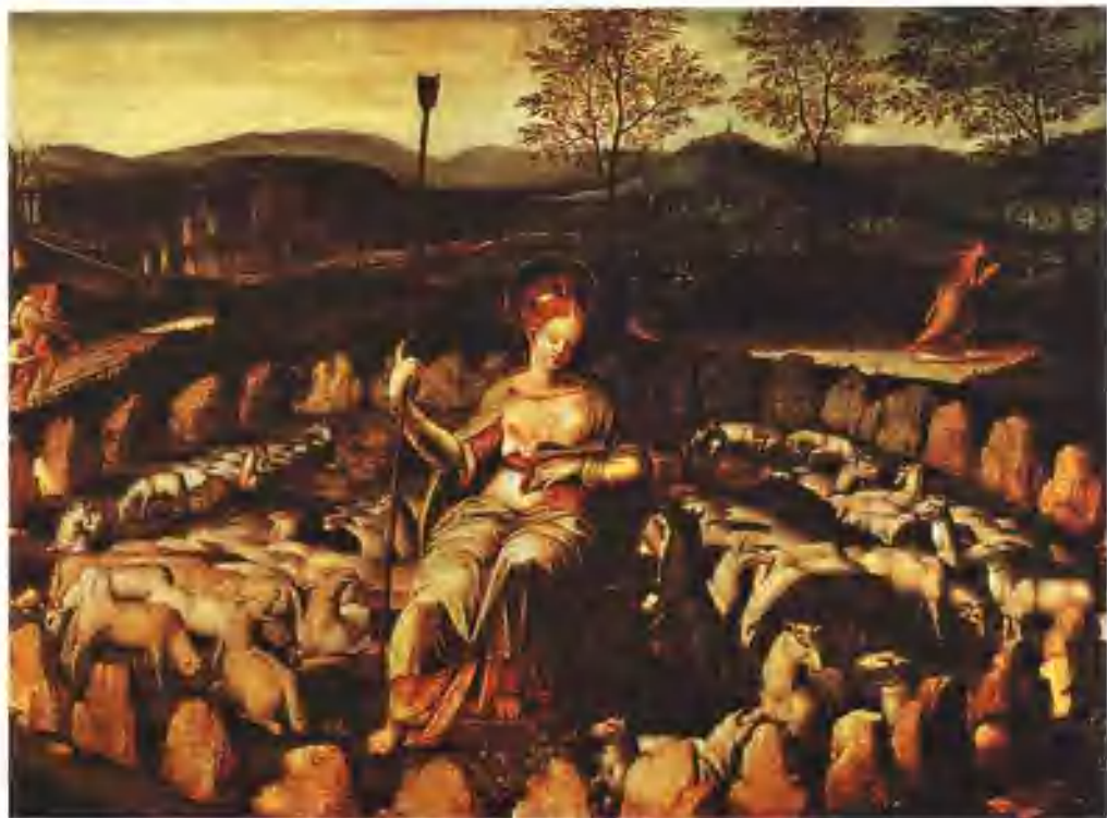
▲ 16世纪关于圣日内维芙（巴黎的保护人）的绘画，她与绵羊在一起。周围环绕着一个史前石圈。这是欧洲巨石文化最古老的画面之一，它把基督教同异教联系在一起。

将它们所代表的文明程度与我们已有的历史知识统一起来。这就是旧科学的尴尬，也是历史的尴尬。有人说，这些都是“神”的印迹，但“神”又是什么呢？