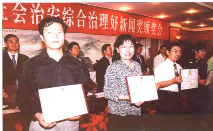
2003年度全国社会治安综合治理好新闻奖颁奖会颁奖场景