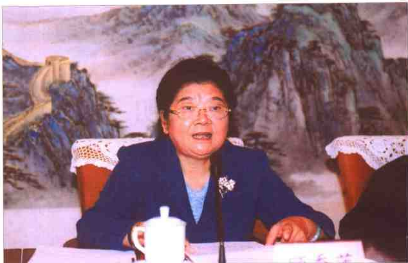
全国人大常委会副委员长、中央综治委副主任顾秀莲同志出席颁奖会并发表讲话。