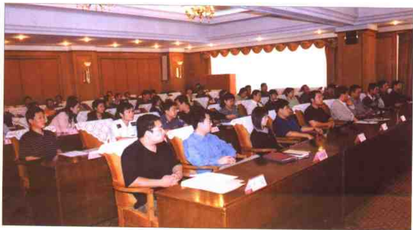
2003年度全国社会治安综合治理好新闻奖颁奖会会场

2004年9月29日，中央社会治安综合治理委员会、中华全国新闻工作者协会隆重举行2003年度全国社会治安综合治理好新闻奖颁奖会。全国人大常委会副委员长、中央综治委副主任顾秀莲同志到会为获奖者颁奖，并发表讲话。中央政法委秘书长王胜俊，共青团中央书记处第一书记周强，中央宣传部副部长、中央文明办主任胡振民，中央政法委副秘书长，中央综治办主任陈冀平，最高人民检察院副检察长朱孝清，司法部党组成员、政治部主任张苏军、共青团中央书记处书记杨岳等领导出席颁奖会。