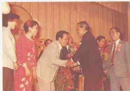
泰国副总理差猜接见 1985.12