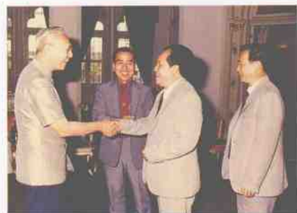
泰国副总理披猜接见 1985.12