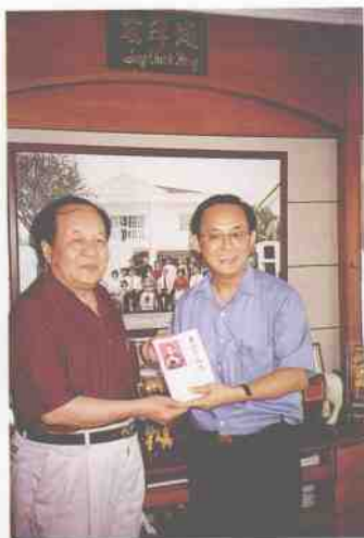
与新加坡议员杨先生合影