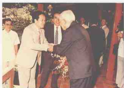
泰国克立亲王接见