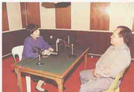
接受马来西亚电台采访