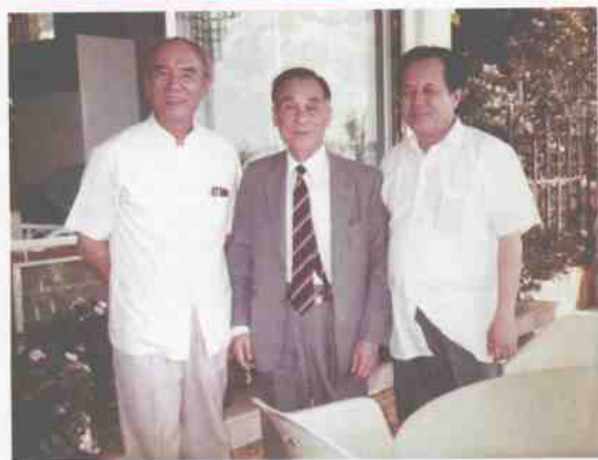
与全国侨联副主席庄世平先生（中）合影 1986.1 泰国曼谷