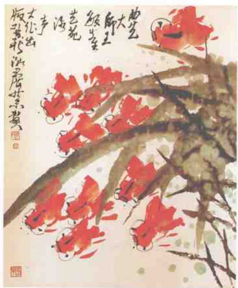
潮剧表演艺术家方展荣贺