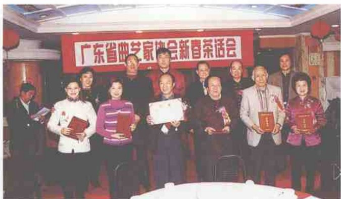
接受省曲艺家协会颁奖 二〇〇〇年元宵节