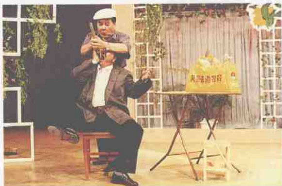
(本人演出相声、小品等的部分剧照)