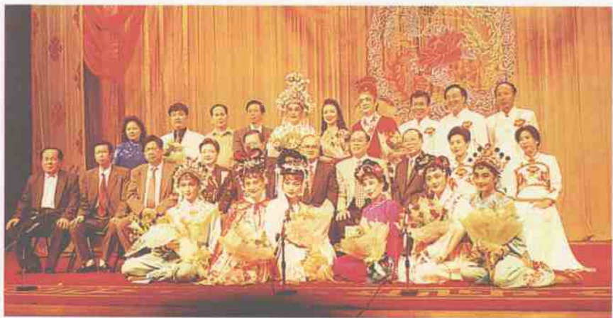
在台北演出时与“考试院”院长许水德合影