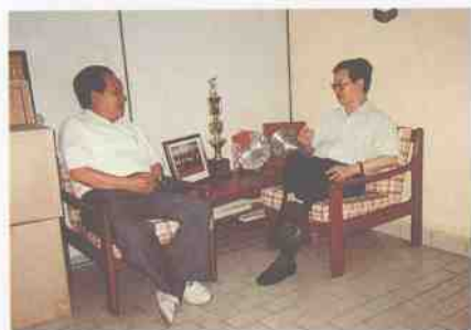
会见新加坡文教部长柯贞治 1993.8 新加坡