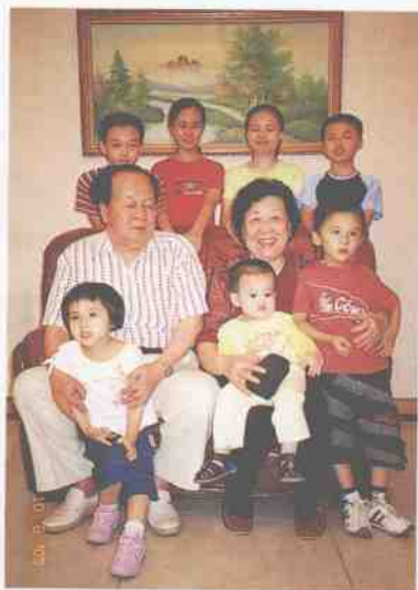
乐在其中 (内外孙四男三女)