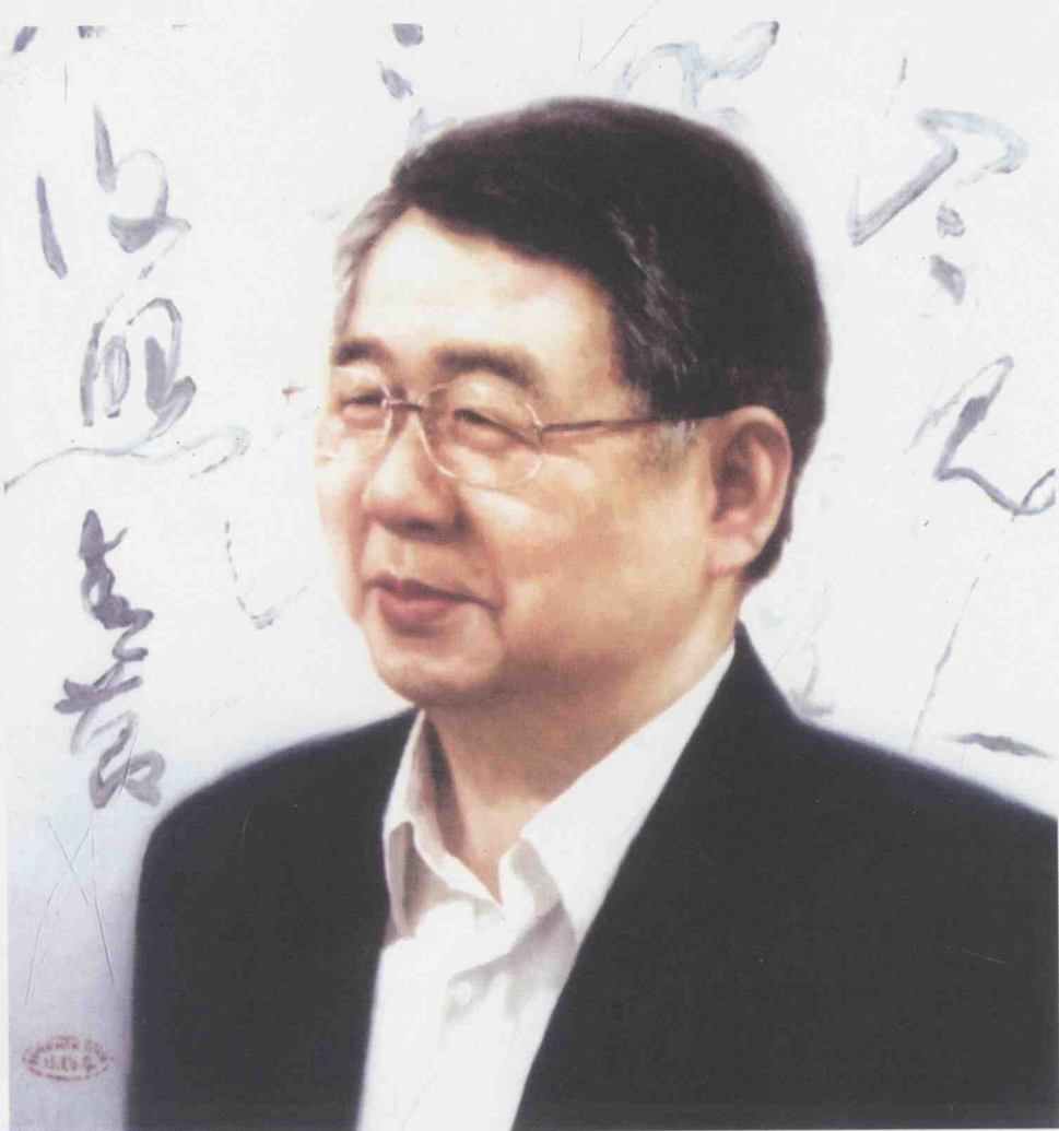
作者照 油画 冯鹤亭 绘