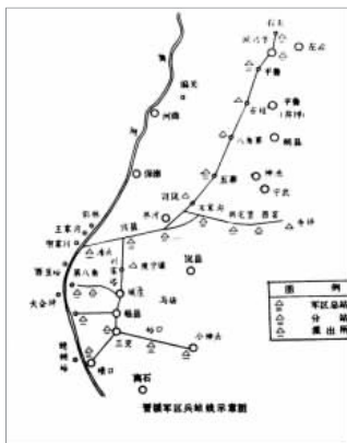
图2 晋绥军区兵站线示意图。

晋西北军区,贺龙任司令员,关向应任政委,并在绥远省的大青山组织武装,后来发展为绥蒙军区,司令员为姚吉。在1942年初正式成立晋绥军区,随之,组成了军区沿线兵站(见图2)。1942年5月中央军委在延安成立了陕甘宁晋绥联防军司令部,贺龙为司令员,这些为创建晋绥边区、扩大抗日根据地奠定了坚实的基础。从1938年起,我军开展对日军交通破袭战,对其主要交通线及沿线据点进行了较为彻底的清除和有利的打击。第一阶段: