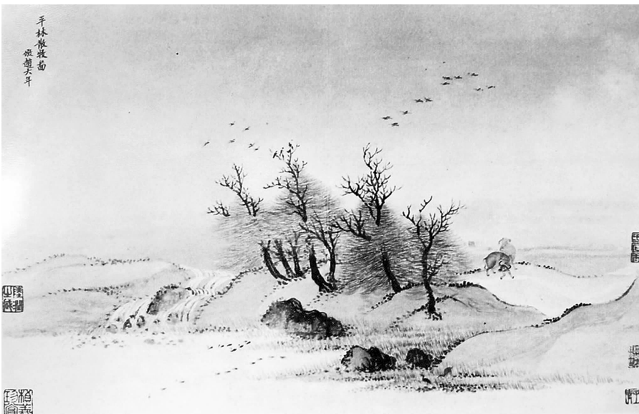
清·王翬《平林散牧图》

爱已残，心早碎，当断箭插入胸膛， 爱恨情仇皆随热血喷涌而出，所有的热 烈苍凉、苦痛悲欢，瞬间有了答案，瞬间 变得简单。