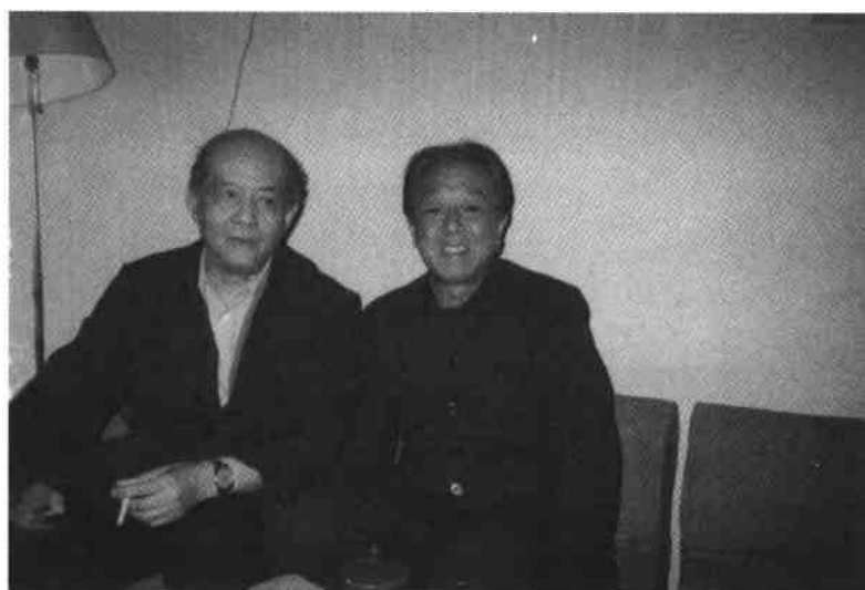
严文井、彭燕郊,1987年,北京