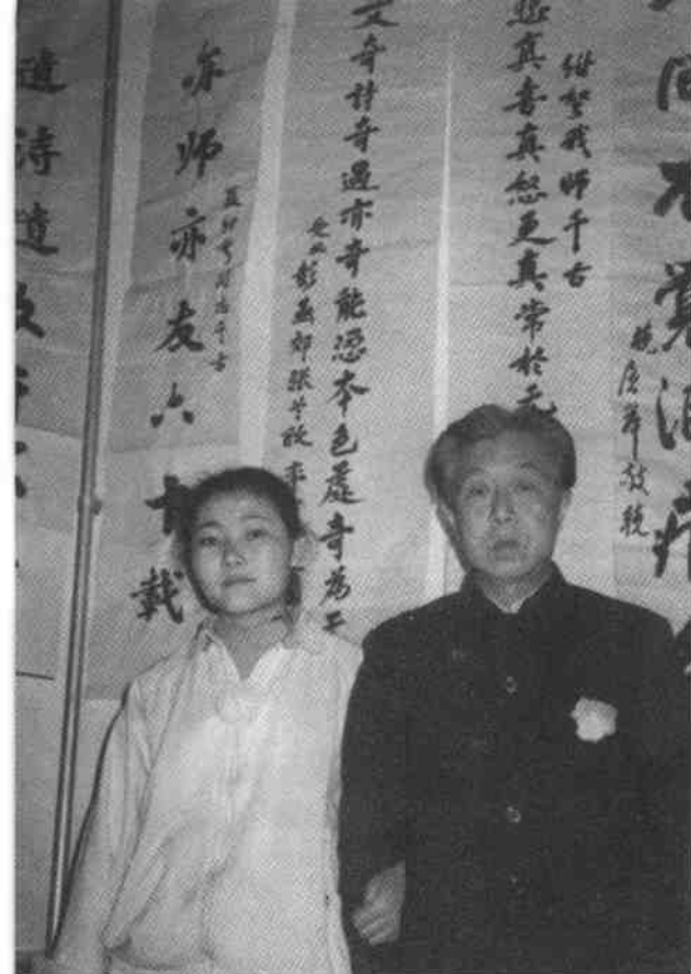
和丹丹参加聂绀弩遗体告别仪式，1986年，北京