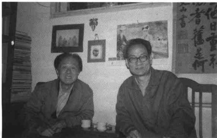
彭燕郊、牛汉，1988年，长沙