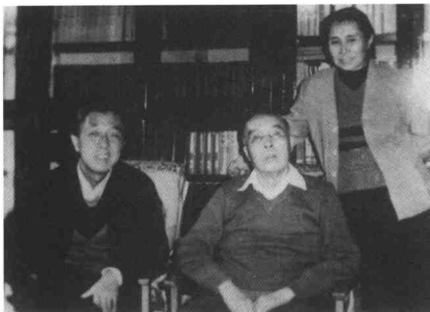
胡风、梅志、彭燕郊,1984年,北京