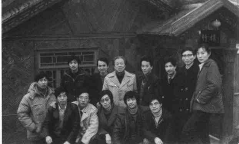
和青年诗友一起(前排中是北岛),1986年,重庆北碚