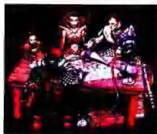
图 1-1-1 奇幻文学的著名产物

以中古世界为背景的奇幻文学作品，在现实书者的口中与创作者的笔下，原本具有骑士、农民、城堡的城邦文化，添加了超自然的精灵、龙等生物及神奇魔法后，让单纯的现实世界增添了许多幻想的美梦。荷马史诗《奥德赛》(Odyssey) 中在海上冒险的交叠，亚瑟王的北伐及《亚瑟王》(The Matter of Britain) 都是奇幻文学的著名产物。