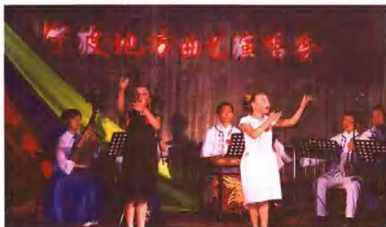
尚田小学课余曲艺班演唱宁波走书《谈理想》(奉化)