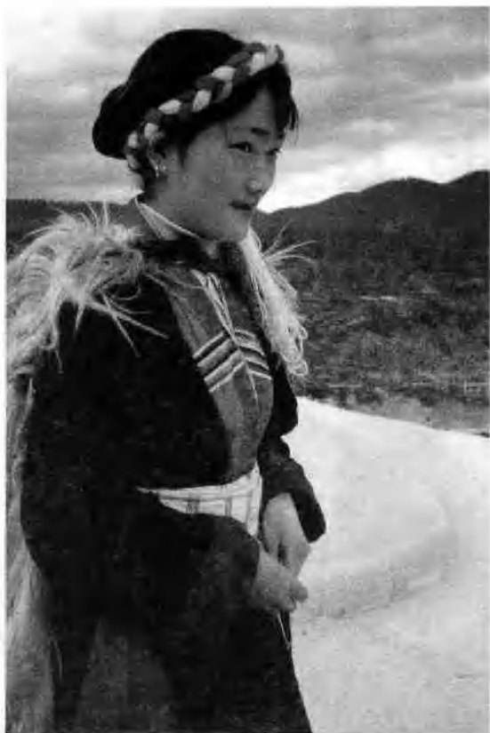
香格里拉县三 坝纳西族乡妇女