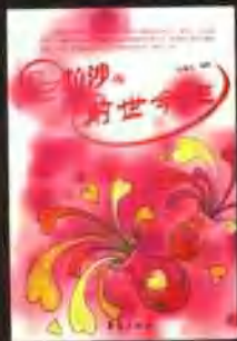
《一粒沙的前世今生》