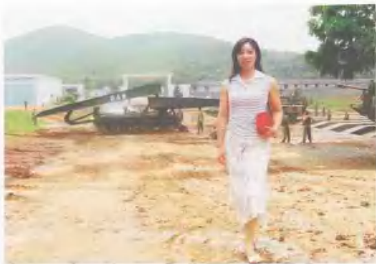
2004年6月在解放军73021部队装甲团