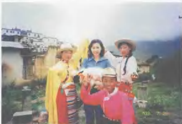
2003年7月在詹姆斯·希尔顿的小说《消失的地平线》一书中香格里拉的喇嘛寺与藏族同胞在一起