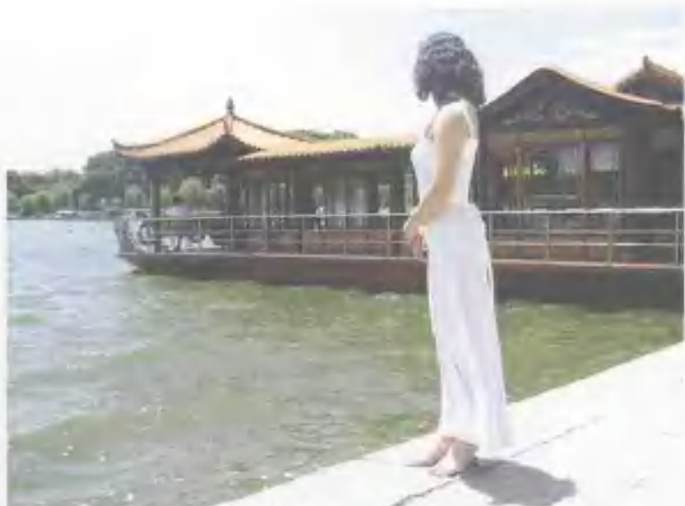
在西子湖畔