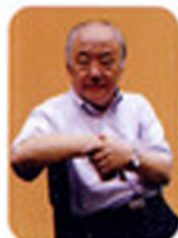
著名学者、教育家 钱理群 主编