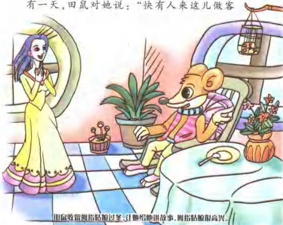
田鼠收留拇指姑娘过冬，让她给他讲故事，拇指姑娘很高兴。

yǒu yì tiān tián shǔ duì tā shuō kuài yǒu rén lái zhèr zuò kè 有一天，田鼠对她说：“快有人来这儿做客