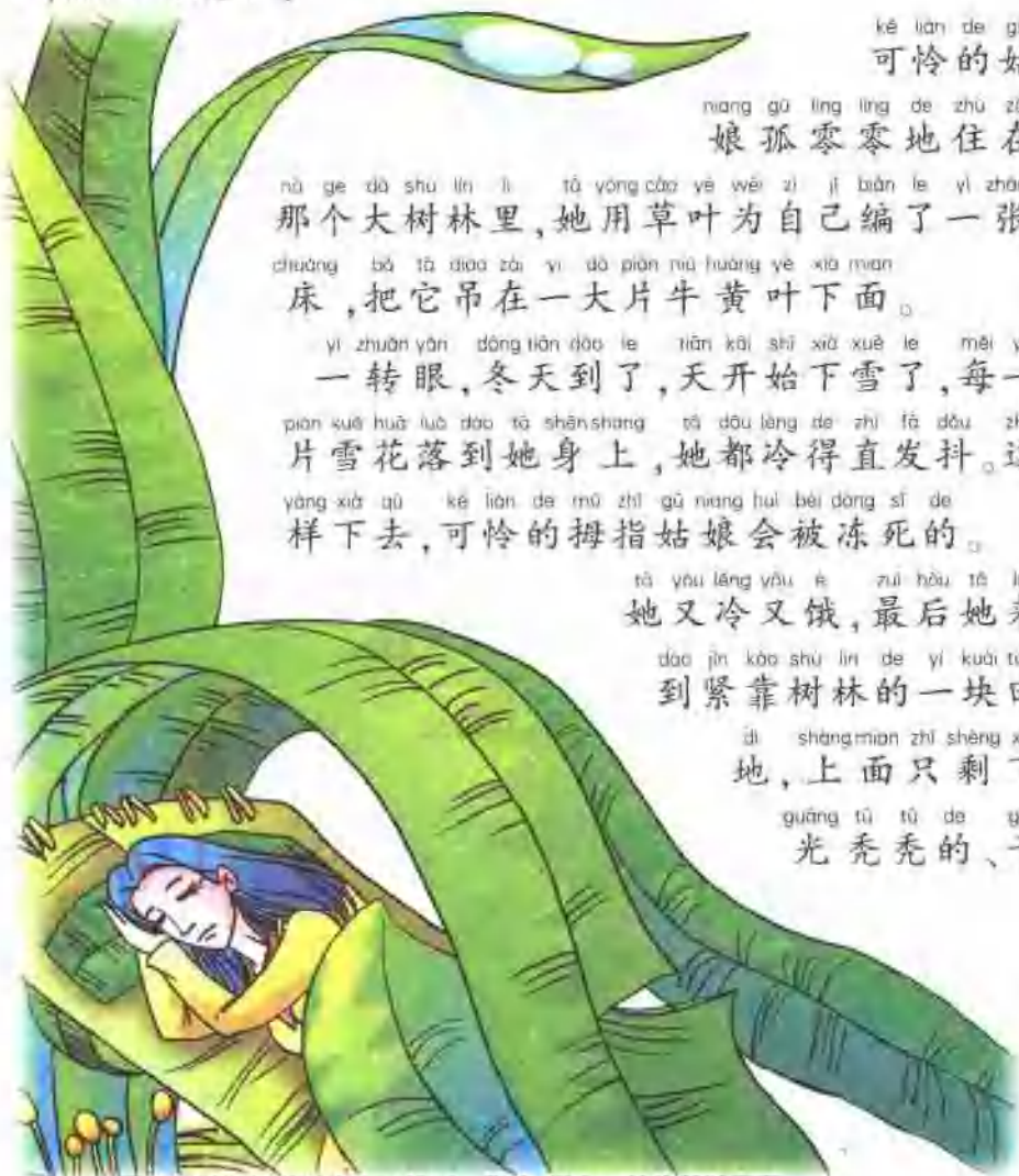
拇指姑娘用草叶为自己编了一张床，吊在一片牛黄叶下面。

dì , shàng mian zhǐ shèng xià guāng tū tū de gān 地 , 上 面 只 剩 下 光 秃 秃 的 、 干