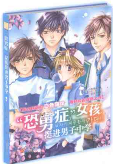
“恐男症”女孩挺进男子中学 定价：20.00元