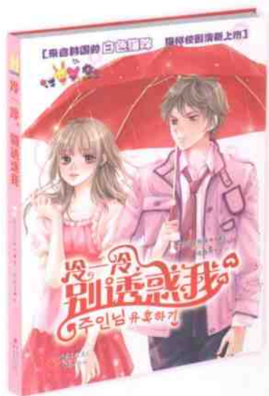
冷一冷，别诱惑我 定价：20.00元