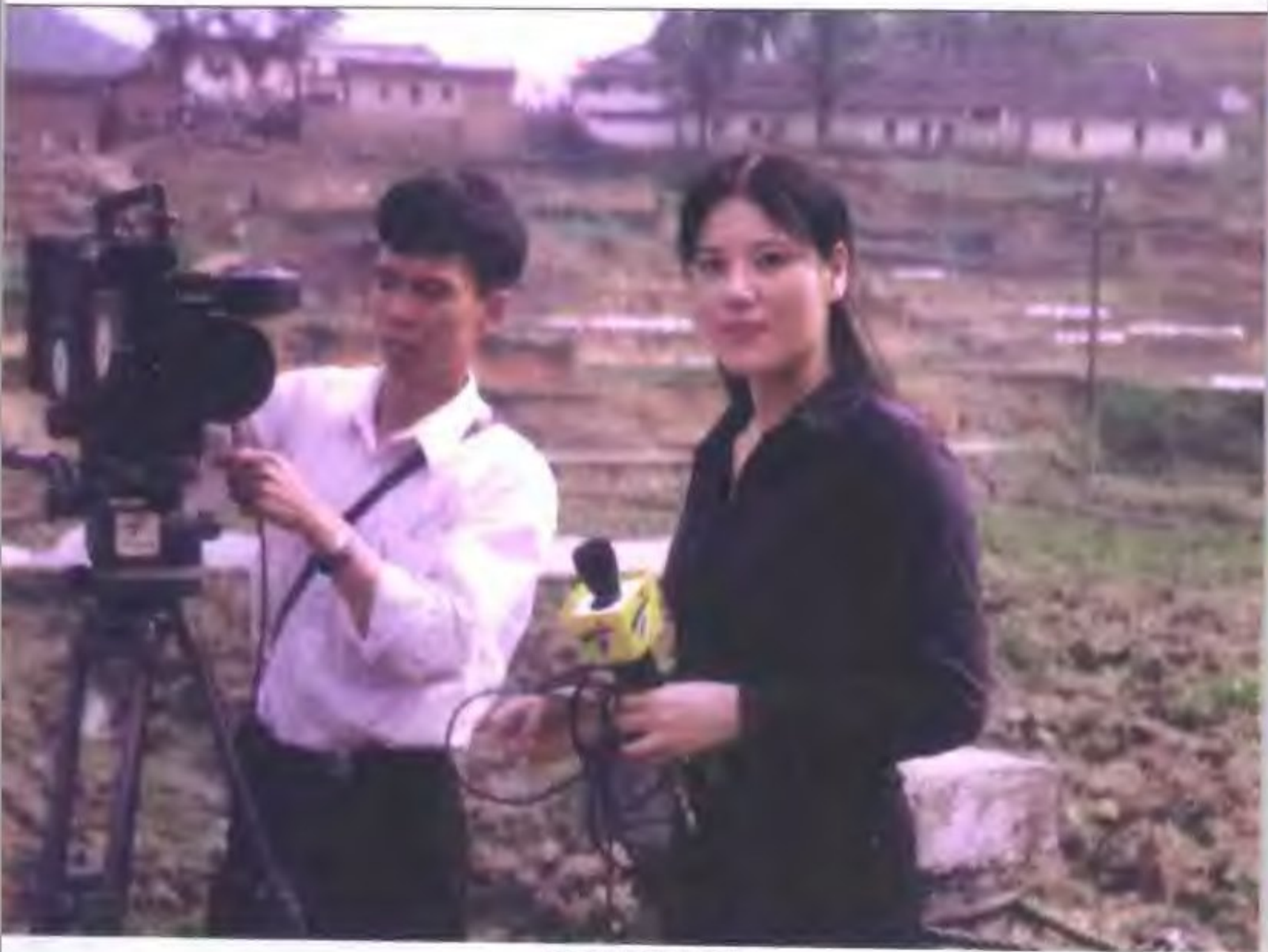
1997年在广东长宁采访