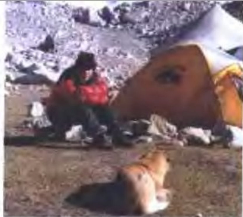
2000年10月西藏，我在珠峰大本营。我喜欢人在旅途的生活。如果说生病也是一项游历的话，那么白血病就是最别开生面的一种。这次旅行是我人生中风险最高，花费最昂贵的一次。