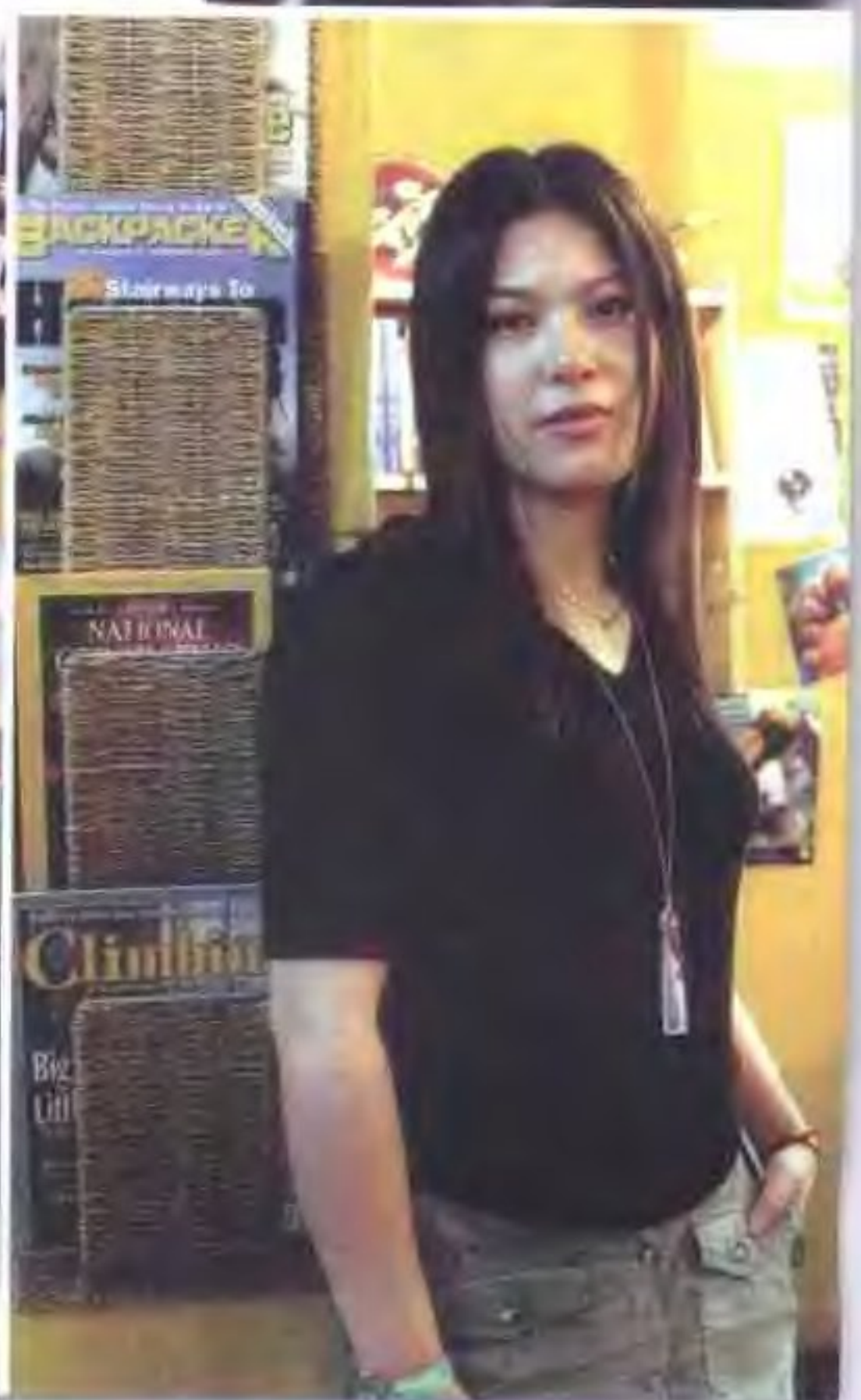
白血病细胞已开始侵蚀我的正常造血细胞，可我浑然不知，还以为牙龈酸痛是因为上火呢。2001年6月25日