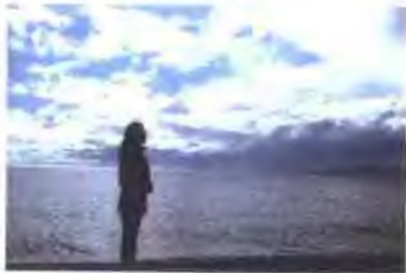
我站在夜幕下的纳木错。她那反复无常的美丽让人不由自主地陷入，不能自拔，如同人生。2000年8月。