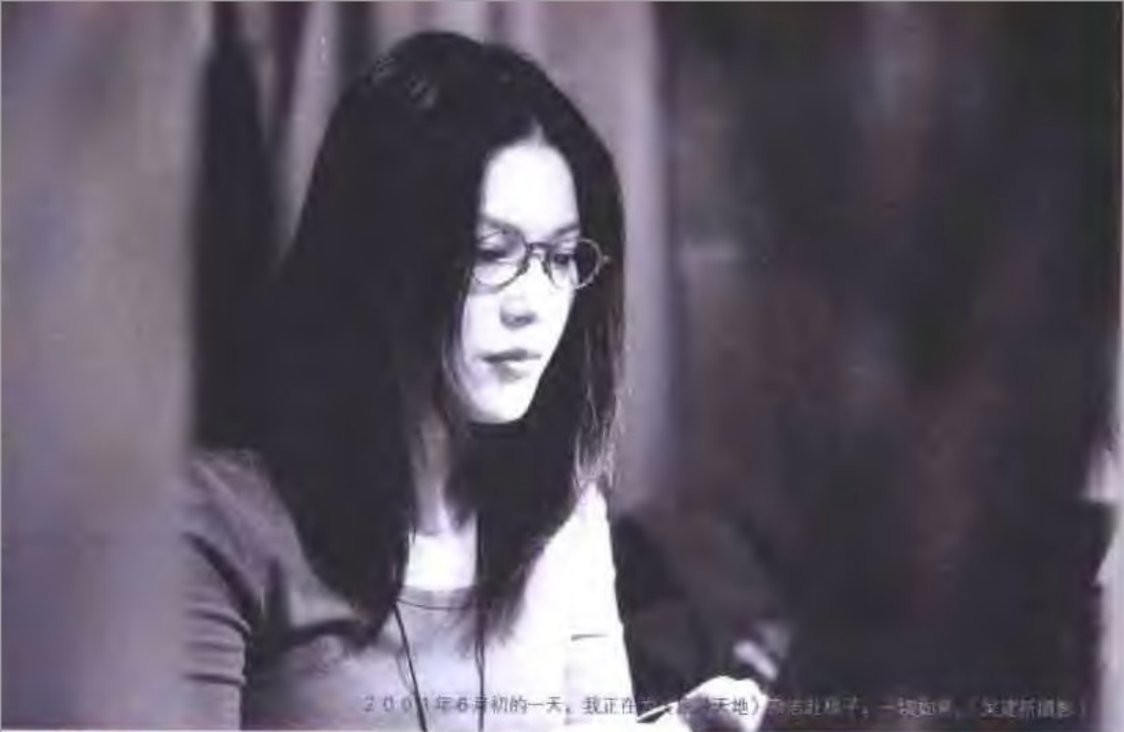
2001年6月初的一天，我正在为《天地》杂志社稿子，一切如常。