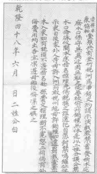
清乾隆年间徽州祁门县罚戏文书 (藏安徽大学徽学研究中心)