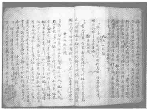
徽州民间艺人保存的目连戏抄本