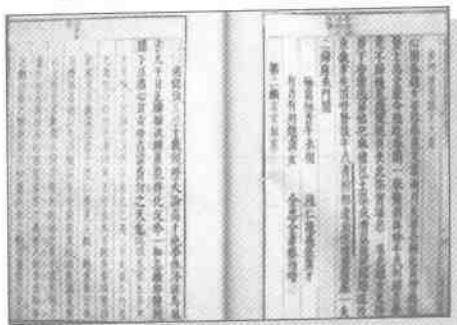
容与堂刊本《李卓吾先生批评琵琶记》