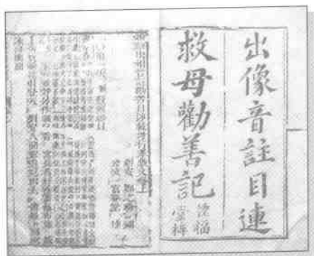
种福堂本目连救母劝善戏文