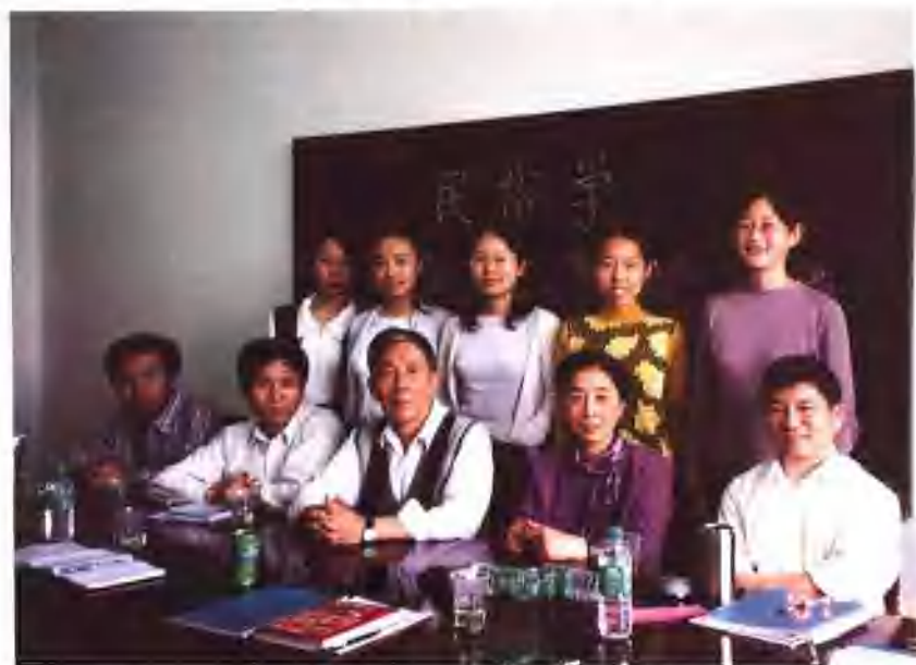
2001年硕士学位论文答辩后师生留影