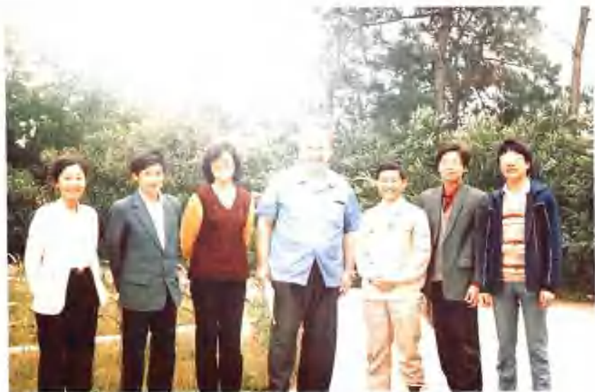
1989年美国阿兰·邓迪斯教授来校讲学留影