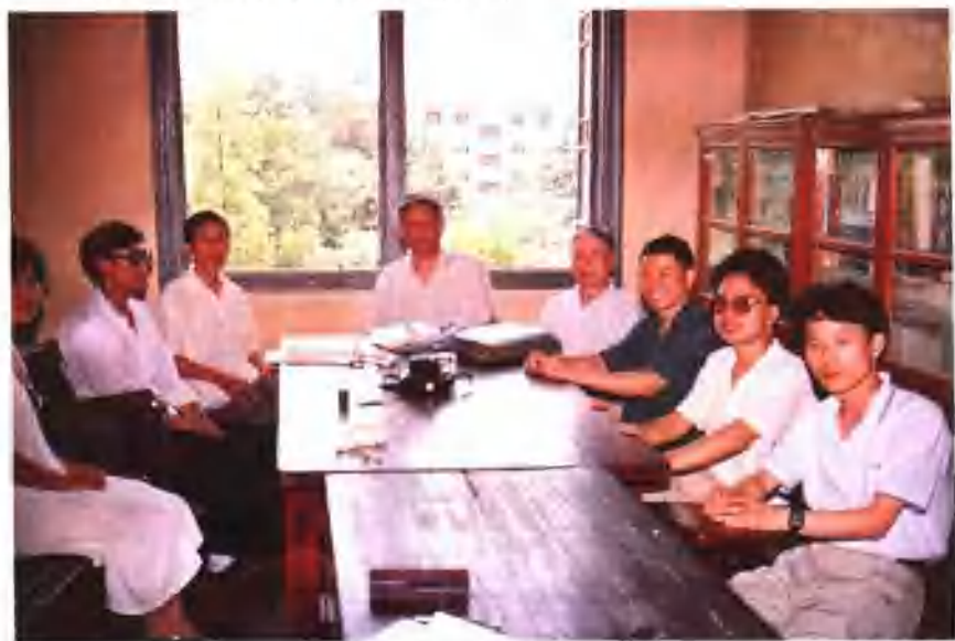
1994年硕士论文答辩后师生留影