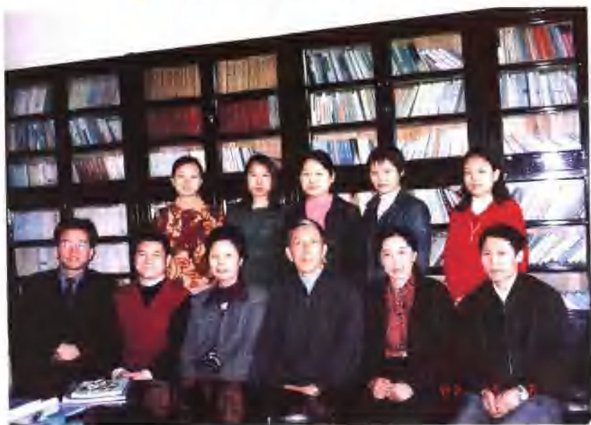
2002年硕士学位论文答辩后师生留影