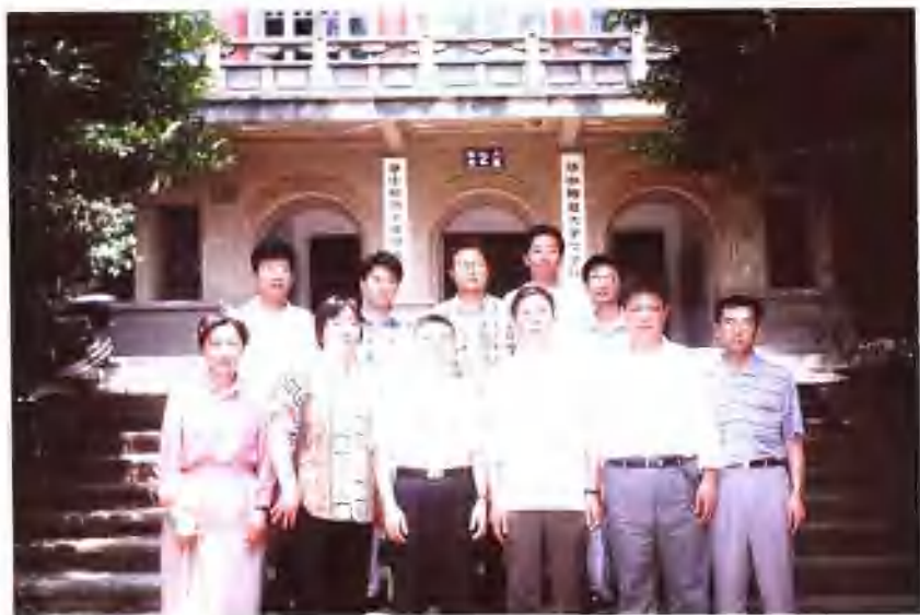
1998年硕士学位论文答辩后师生留影