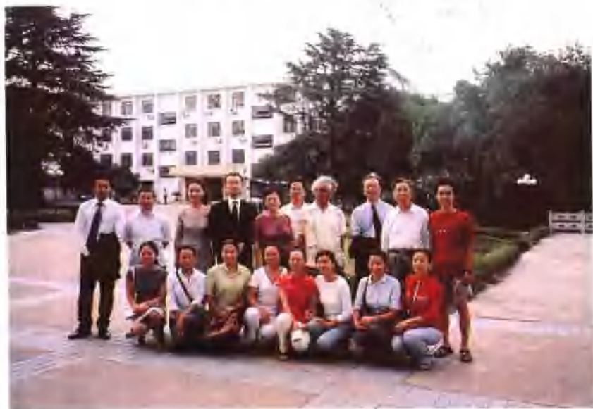
2003年日本小泽俊夫、桥谷英子教授来校讲学留影