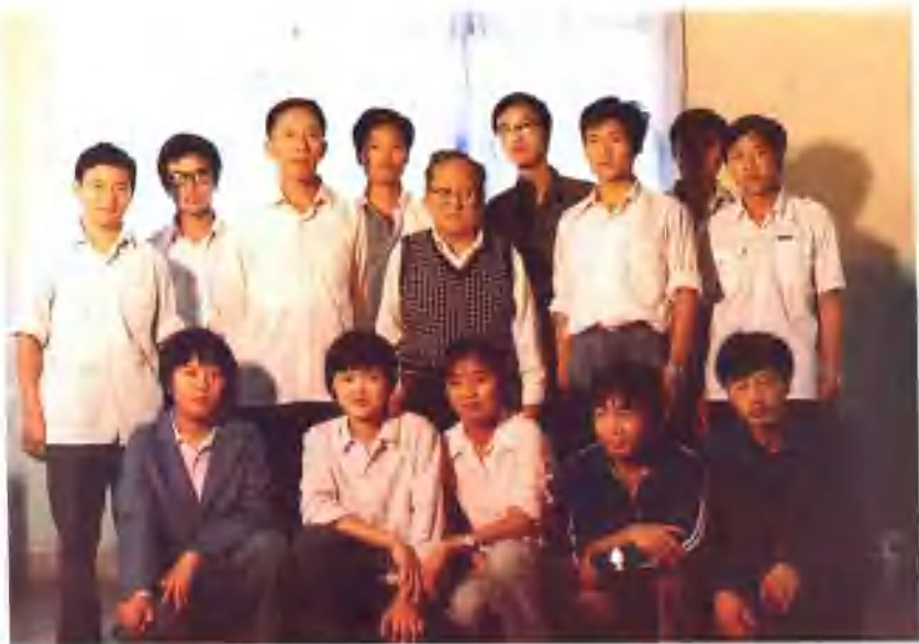
1985年美国丁乃通教授来校讲学留影