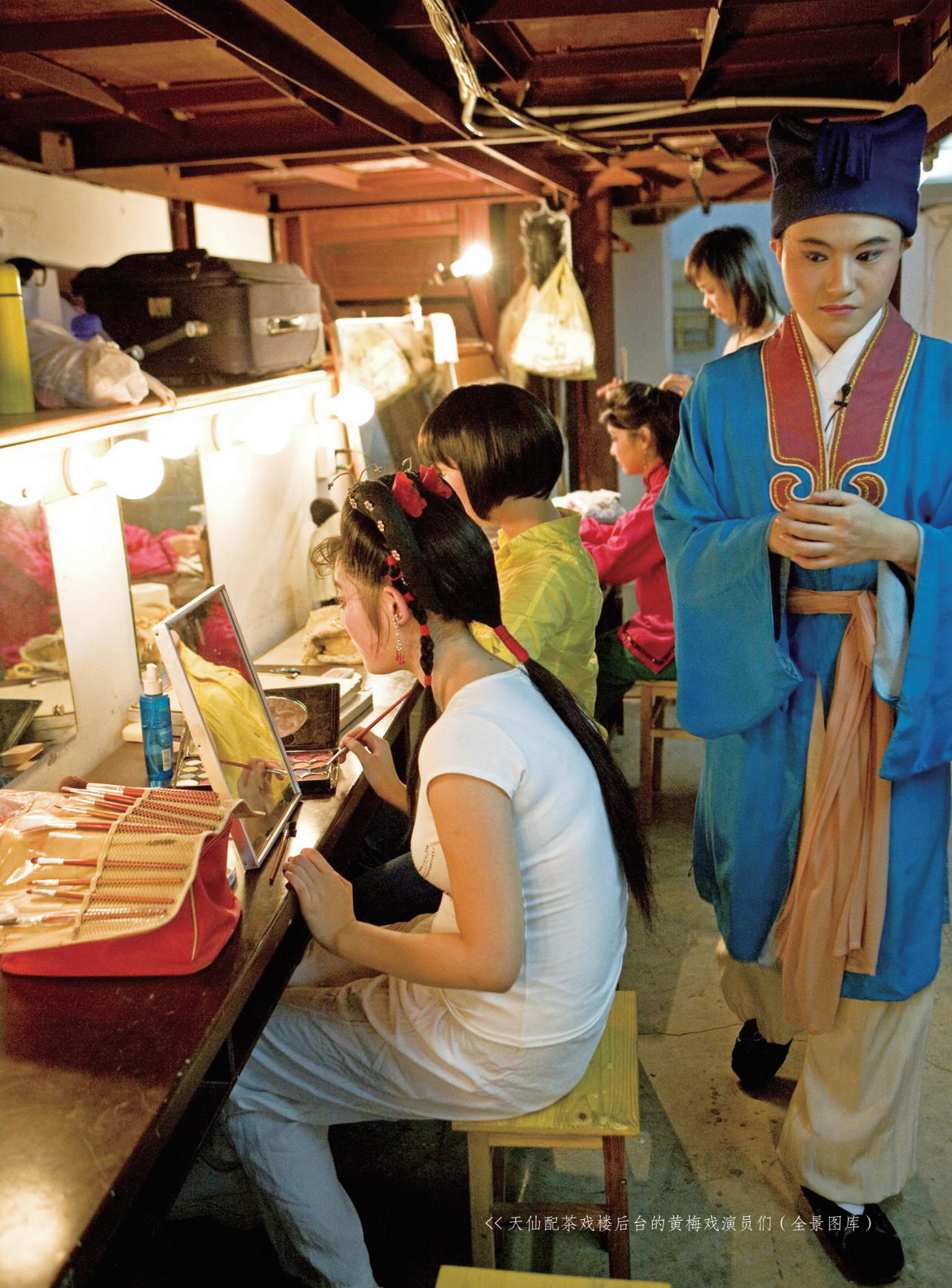
《天仙配茶戏楼后台的黄梅戏演员们（全景图库）》