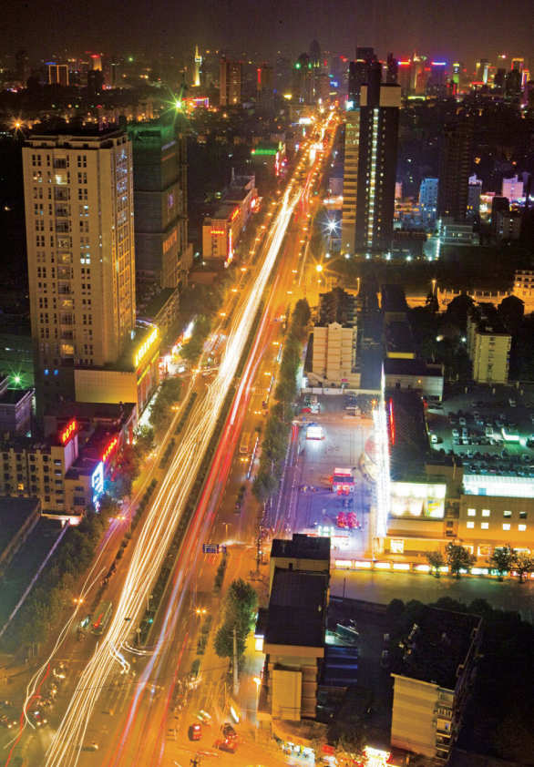
<< 合肥城市夜景（全景图库）

价值标准，一个长期形成的集体无意识的信念，一个独立的目标，而是跟着潮流走，追着时尚行，喜欢模仿，缺少创新，来得快，去得也快。