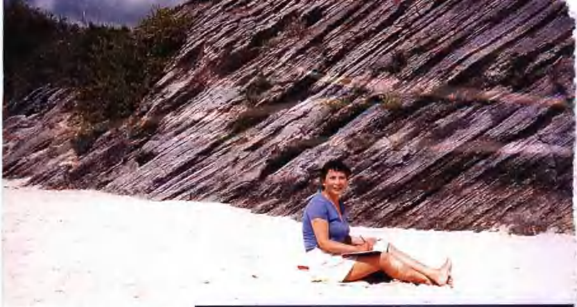
在百慕大海滩阅读写作