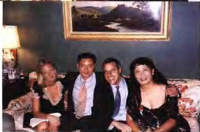
在公园大道凯瑞先生的府邸与友人欢聚