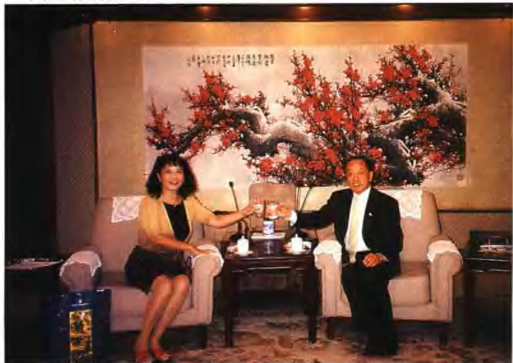
与前中国驻美国大使、现外交部长李肇星在北京外交部合影