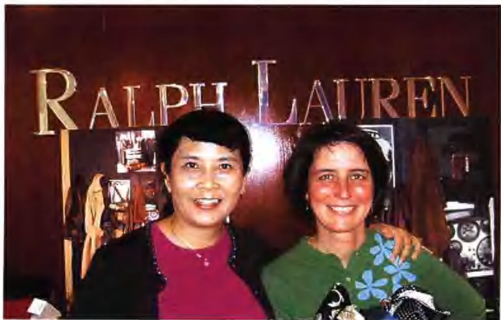
做美国名牌买方代理充满乐趣