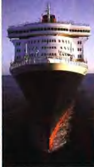
QUEEN MARY 2