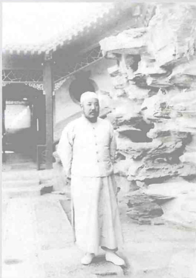
马鸿逵着休闲装在“将军第”中院假山前留影