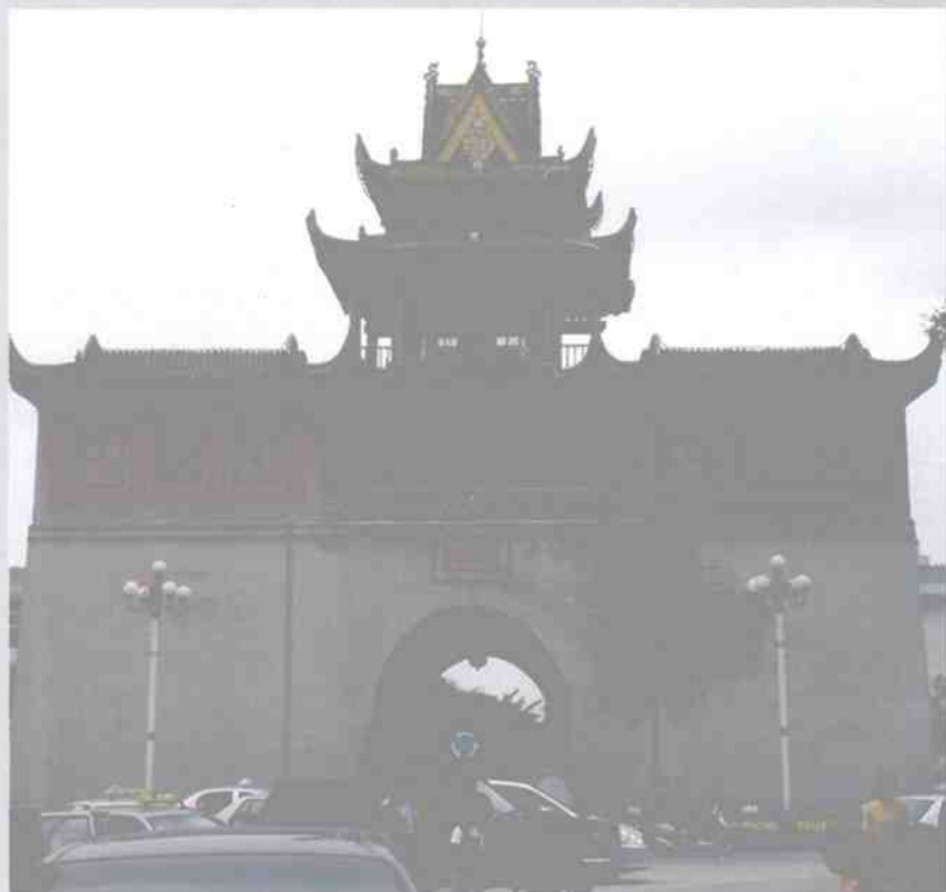
玲珑隽秀的银川鼓楼风姿不减当年