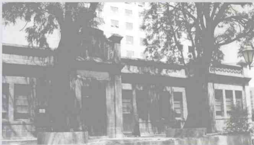
银川市至今保存完好的原宁夏省政府办公厅旧址