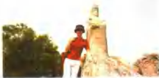
2002年4月24日，我的妈祖情缘从这一天开始。

看着滔滔的海水，我陷入了沉思。成年累月同海水搏斗的沿海一带的劳动人民，从一开始便在寻找海上保护神，先是海神，