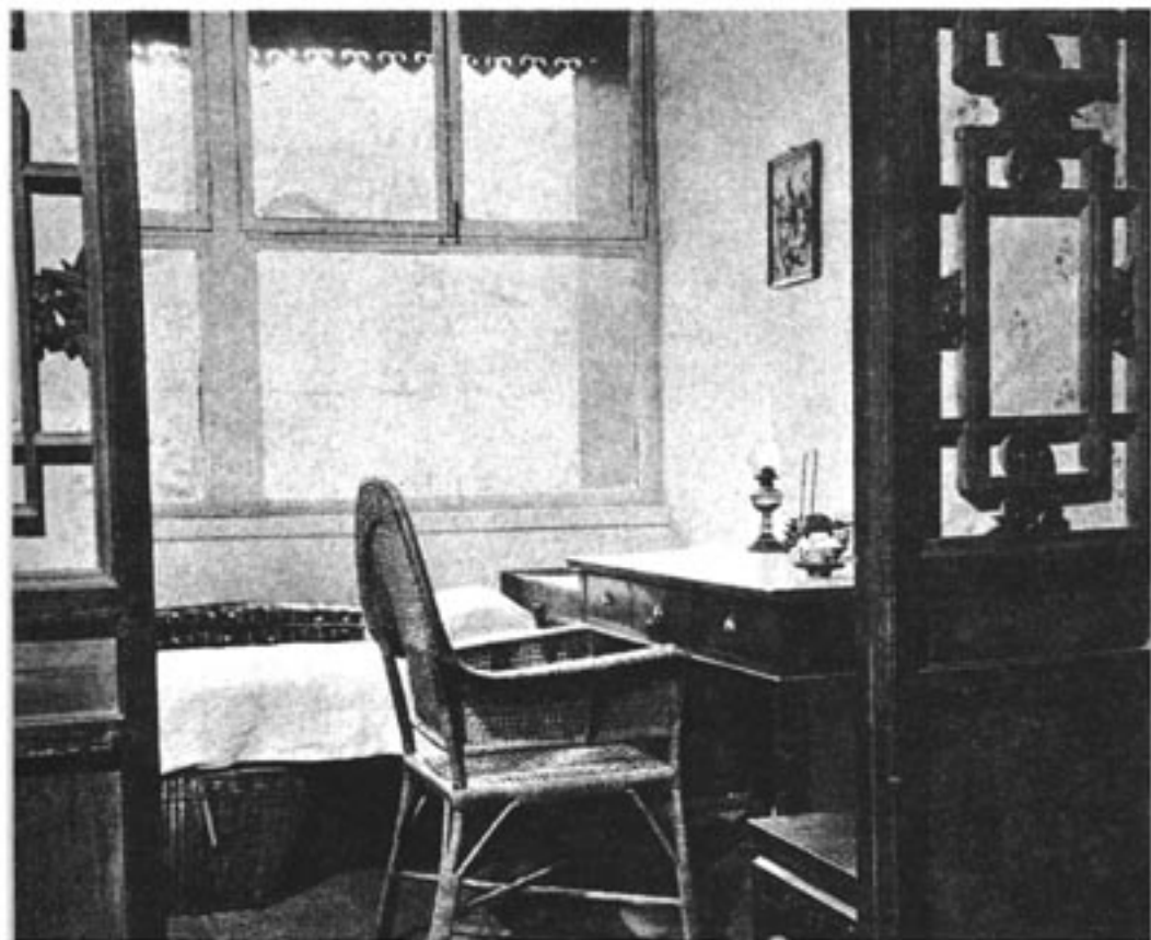
北京西三条寓所之“老虎尾巴”