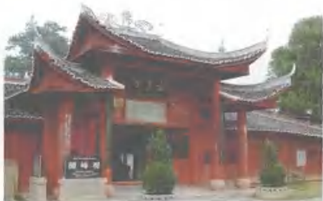
全国重点文物保护单位——醴封观