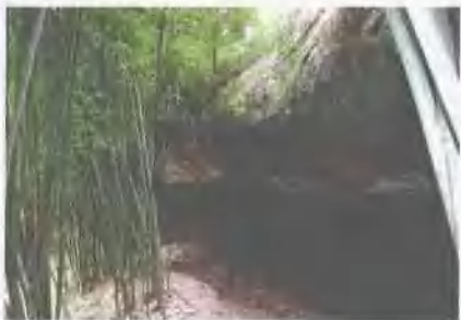
北宋陈氏三兄弟读书处——漱玉岩