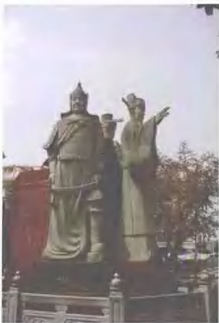
北宋陈氏三兄弟雕塑 (陈尧叟、陈尧佐、陈尧咨)