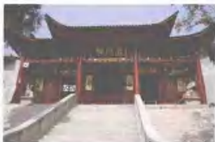
三国淮周故里——上乘寺