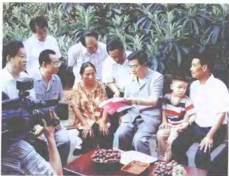
2004年8月13日，中共中央总书记、国家主席胡锦涛在南部县望月村与村民亲切交谈。