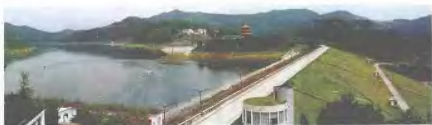
西南最大的人工湖——升钟水库