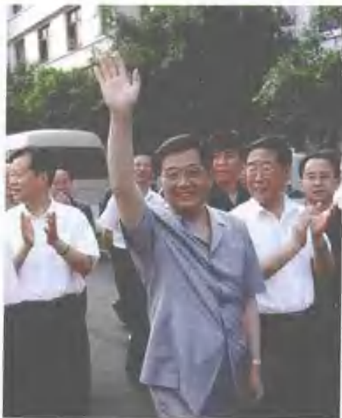
2004年8月14日，中共中央总书记、国家主席胡锦涛在南部县城向人民群众挥手致意。