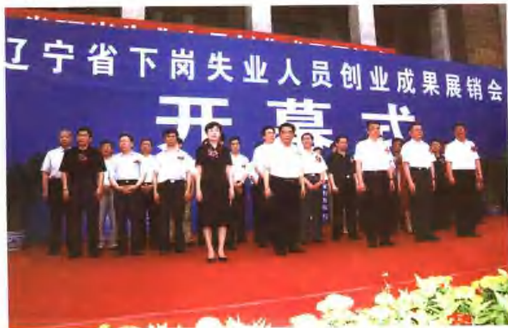
省委、省人大、省政府、省政协领导出席第二届辽宁省下岗失业人员创业成果展销会。