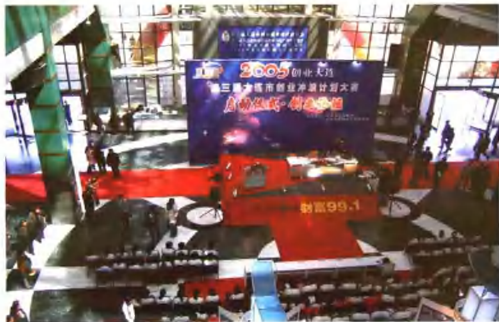
搭建创业就业扶持平台，激发下岗失业人员的创业热情，营造有利于创业的社会氛围。