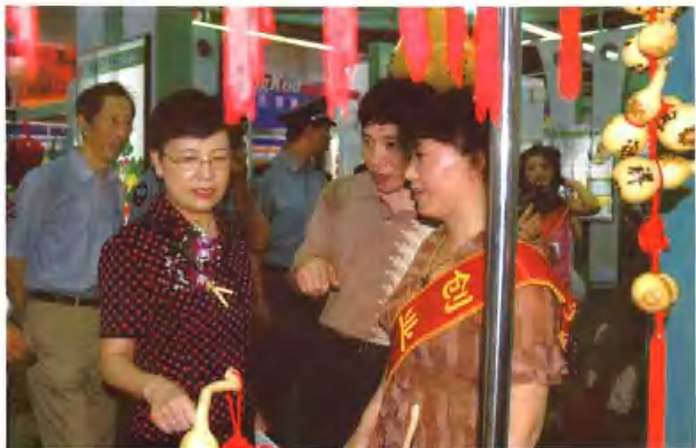
副省长鲁昕视察第二届辽宁省下岗失业人员创业成果展销会葫芦岛市展区。