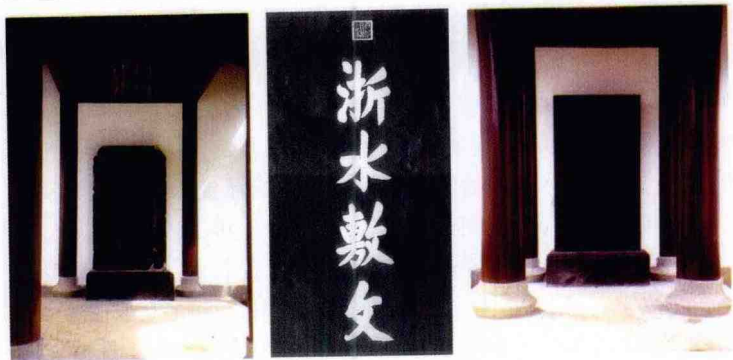
书院内的重要碑刻

书院自大门起原有三座石碑坊,分别是:“万世师表”、“德侔天地”、“道贯古今”。另有芙蓉岩、可汲亭、石匣泉、毓秀阁等建筑,规模宏大、气势磅礴。清时,康熙、乾隆两帝南巡时分别赐额“浙水敷文”、“湖山萃秀”,使书院更加兴旺。清末,万松书院逐渐由盛转衰直至荒废。咸丰十一年(1861),万松书院毁于兵火。后虽有几次重建、重修,终因清政府日渐衰落而衰败。光绪十八年(1892),万松书院迁至葵巷,改称“敷文讲学之庐”。万松书院从其始建之日(1498年)算起,在漫长的500多年岁月中,几经兴衰毁建,至此已湮没殆尽,遗址只剩一座“万世师表”石碑坊,一对石狮和一块刻有孔子像的照壁了。