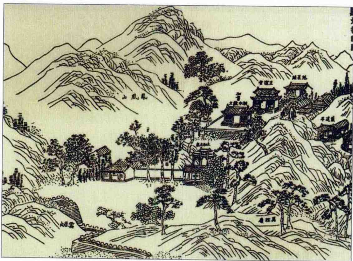
《南巡胜迹图》中的《敷文书院图》

相传,在万松书院曾演绎过梁山伯与祝英台同窗三载,并由此相识、相知、相慕的动人故事,故而,百姓又将此地称为梁祝书院。重建后的万松书院,将“梁祝”传说与书院文化结合在一起,既体现了古代书院教育的历史及文化内涵,又处处体现“梁祝”传说——这一不可多得的民间文化遗产,使两者相互映衬、相得益彰。