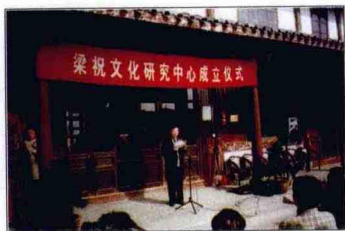
江浙沪梁祝文化研究会成立

近年来，宁波市先后举办了二届“中国梁祝婚俗节”，并建设了梁祝文化公园，公园以梁山伯庙为主体，梁祝故事为主线，构建了众多景点。1987年，江浙沪三地的民间文学家、历史学家在宁波召开梁祝学术研讨会，探讨梁祝故事发源和发展。1997年7月，宁波的梁山伯庙出土一座晋代墓葬，墓的位置、规格和随葬器物与志书记载的梁山伯鄞县县令身份和埋葬地相吻合，被认为是可信的实物资料。2002年初，经中国民间文艺家协会批复同意，中国梁祝文化研究会落户宁波。5月，梁祝文化国际学术研讨会在宁波举办，联合国教科文组织官员和10多个国家地区的专家学者再次深入探讨梁祝文化