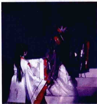
日本宝冢歌舞剧团版“梁祝”