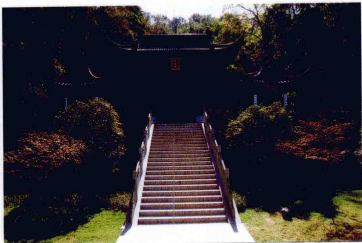
万松书院祭孔处：大成殿