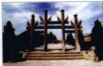
宁波梁山伯庙古牌坊