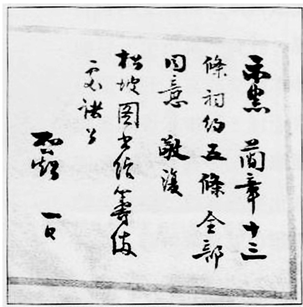
梁启超为蔡锷身后筹办图书馆