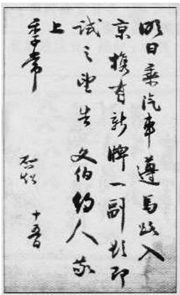
梁启超写信约人打牌