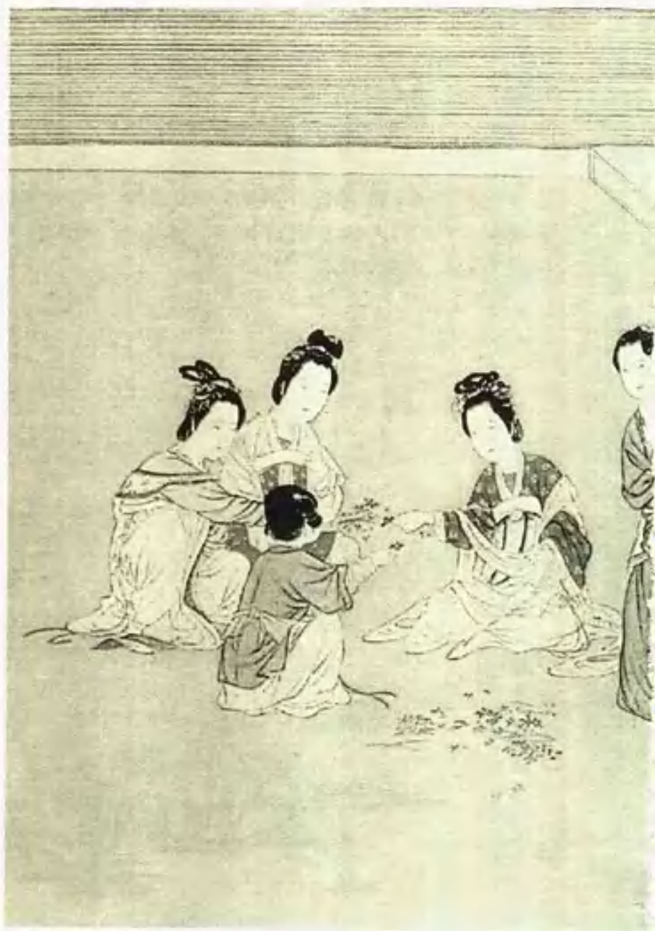
汉宫春晓图卷（局部）