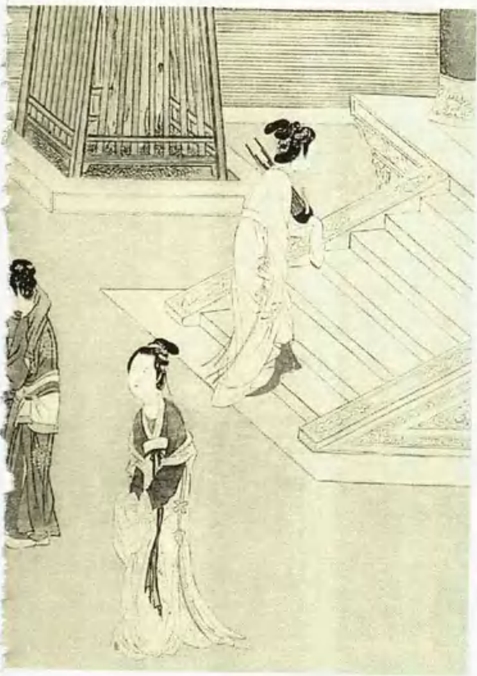
◆ 声容 ◆ 云想衣裳花想容