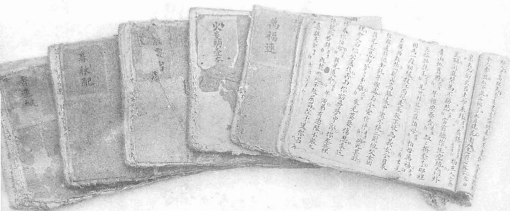
李芳桂创作的八本剧目手抄本