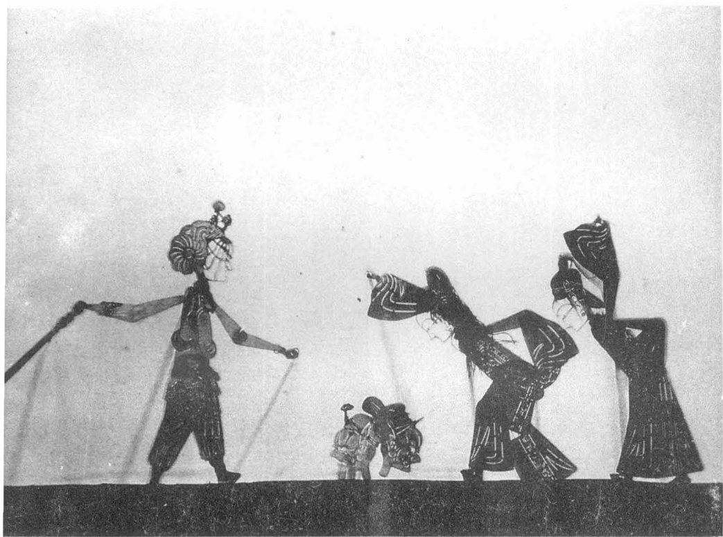
《万福莲 杀差官》剧照 华县光义碗碗腔皮影社演出