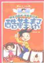
老布鞋战胜“耐克帮”