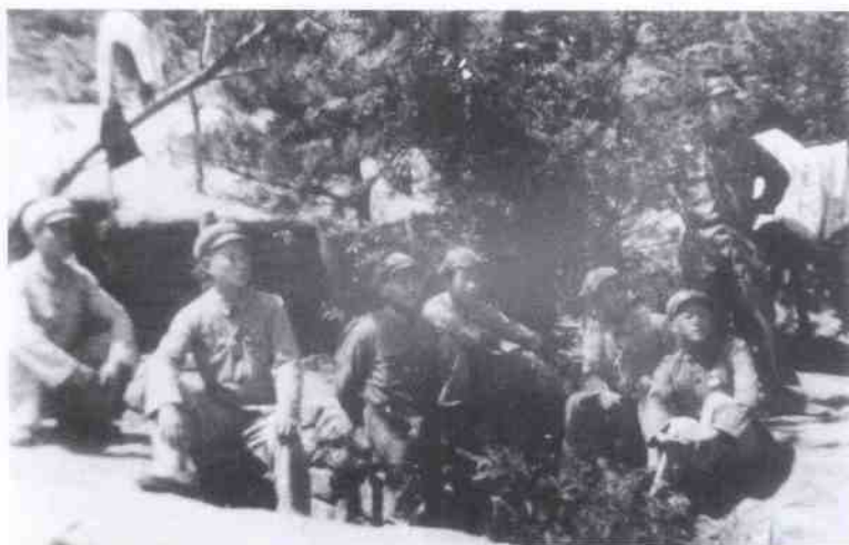
1953年8月10日，朝鲜停战半月，志愿军步兵第四四四团政治处部分工作人员满怀喜悦在本处掩蔽部（办公室兼卧室，位于朝鲜西海岸身弥岛云从山麓）前留影。左2为作者。