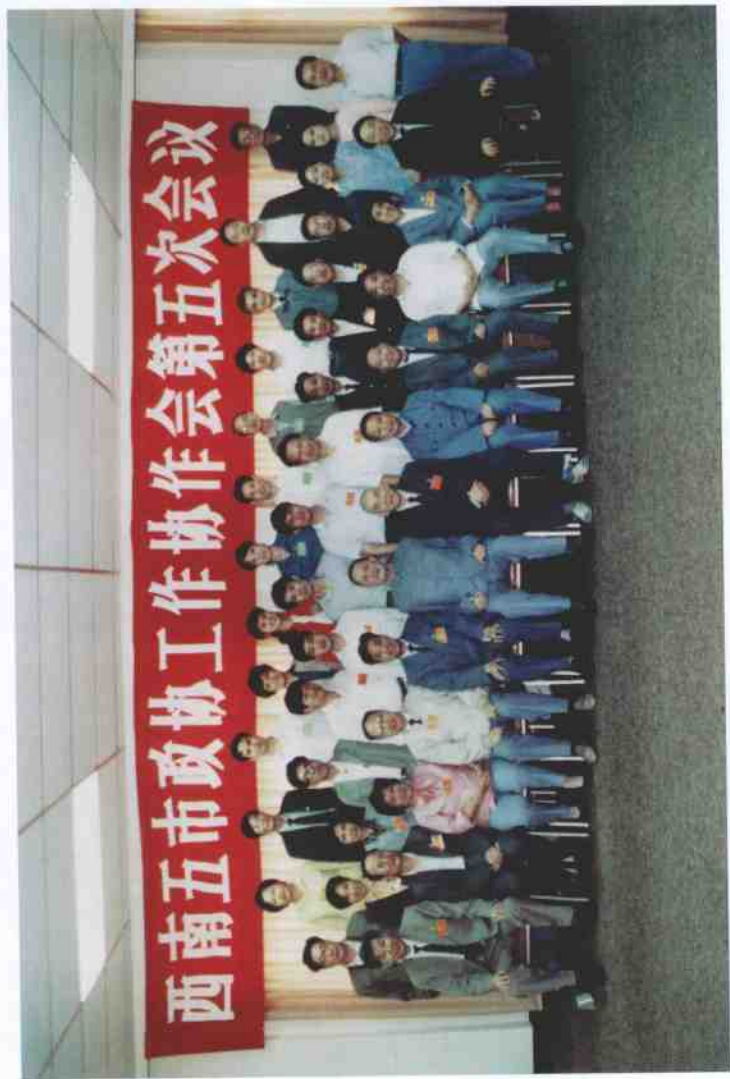
1990年5月15日，全国政协副主席洪学智（前左6）于重庆渝州宾馆接见西南五市政协工作协作会第五次会议代表及工作人员。四川省政协副主席李培根（前左7）等参加。后右6为作者。