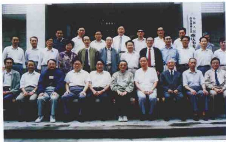
1992年9月23日，全国政协副主席、三峡工程论证领导小组组长钱正英（前右5）来重庆视察工作，与市有关领导和市政协机关部分干部合影。前右4为重庆市政协主席黄冶。中右2为作者。