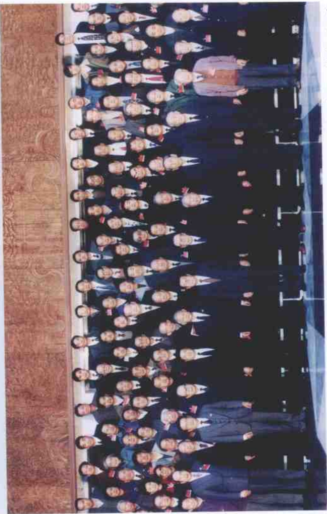
1995年11月9日，中共中央政治局常委、全国政协主席李瑞环（前左8）和全国政协叶选平（前左7）等7位副主席接见政协全国文史工作座谈会代表的合影（剪裁）。后排左7为作者。