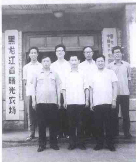
1983年8月，作者（前中）在黑龙江省曙光农场担任总局、管理局两级党委整党试点调查组组长期间，同调查组全体成员合影。