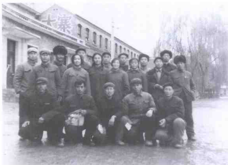
1974年8月，作者（后左1）随黑龙江生产建设兵团第三十九团学习考察团部分成员参观大寨。