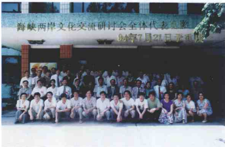
1994年7月21日，在重庆师范学院举行的海峡两岸文化交流研讨会全体代表的合影。三排左8为作者。