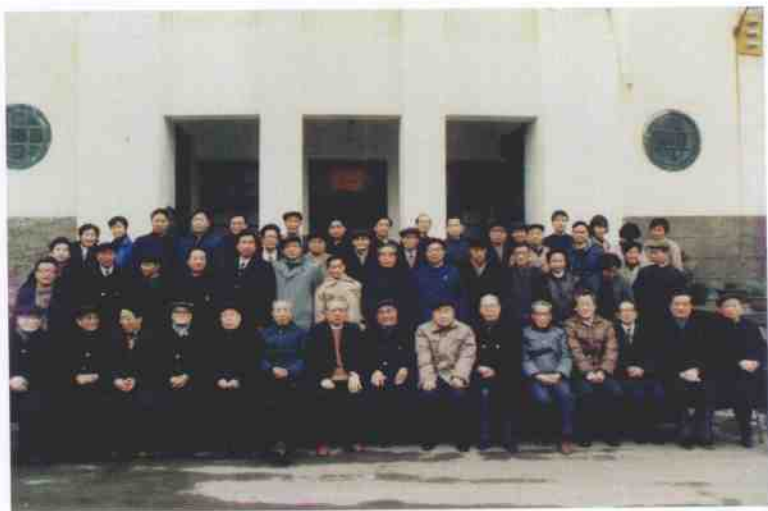
1988年2月24日，重庆市政协各副主席和部分机关干部欢送中共重庆市委书记、市政协主席廖伯康（前左8）离任的合影。前左7为市政协党组书记、常务副主席宋元良。后排右5为作者。