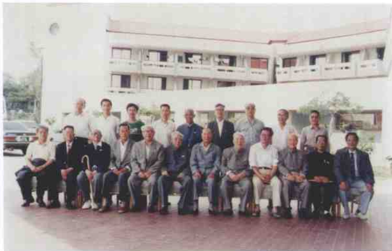
1989年8月24日，全国政协在北戴河全国政协疗养院召开省级文史资料委员会主任会议期间，全国政协副主席孙晓村、原副主席杨成武（前左6、7）等领导同志与西南组成员合影。后左4为作者。