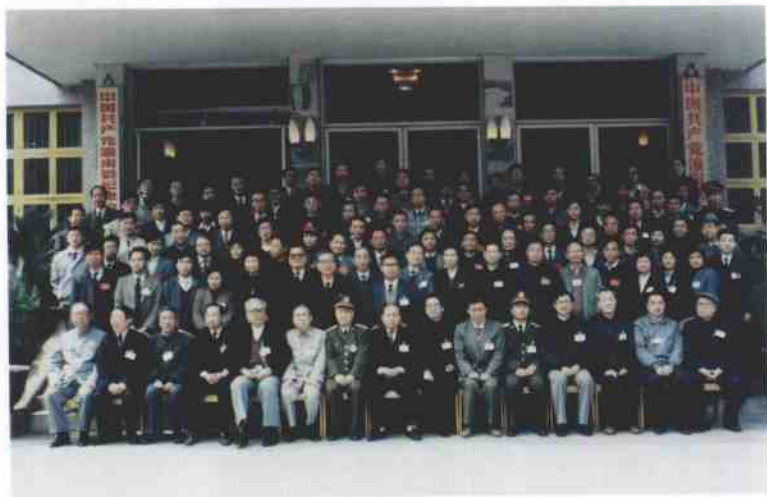
1992年4月6日，中共中央政治局委员、四川省委书记杨汝岱、成都军区副政委邵农中将、中共重庆市委书记萧秧（前左8、7、9）等领导同志在重庆潼南县委机关与出席“重庆市纪念‘三·三一’惨案暨杨闇公同志牺牲65周年大会”代表合影。二排右8为作者。