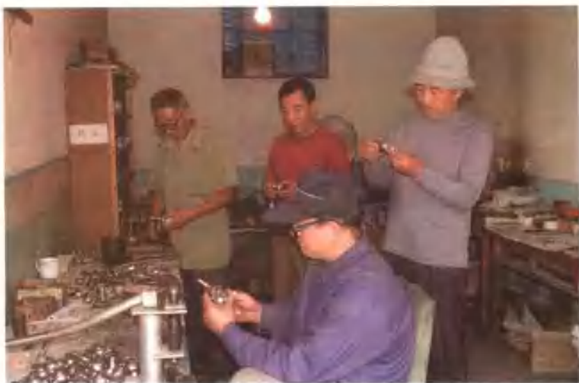
乐亭县军休所开展多种生产经营，办起了青蛤养殖场、修造厂等，取得了较好的经济效益。