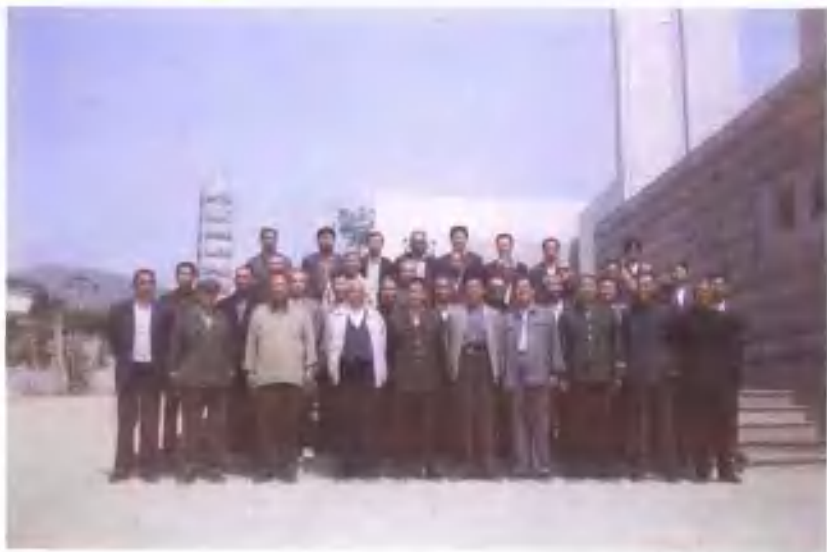
乐亭县军体干部参观潘家戴庄惨案纪念馆合影。