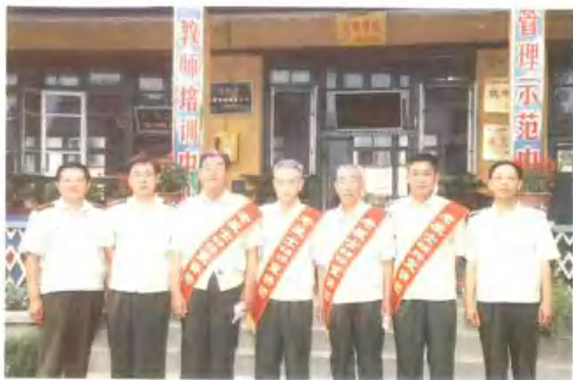
乐亭县军体干部组成革命传统教育报告团，做报告几十场（次），听众达十万余人。这是报告团在乐亭县第一实验小学报告时的合影。