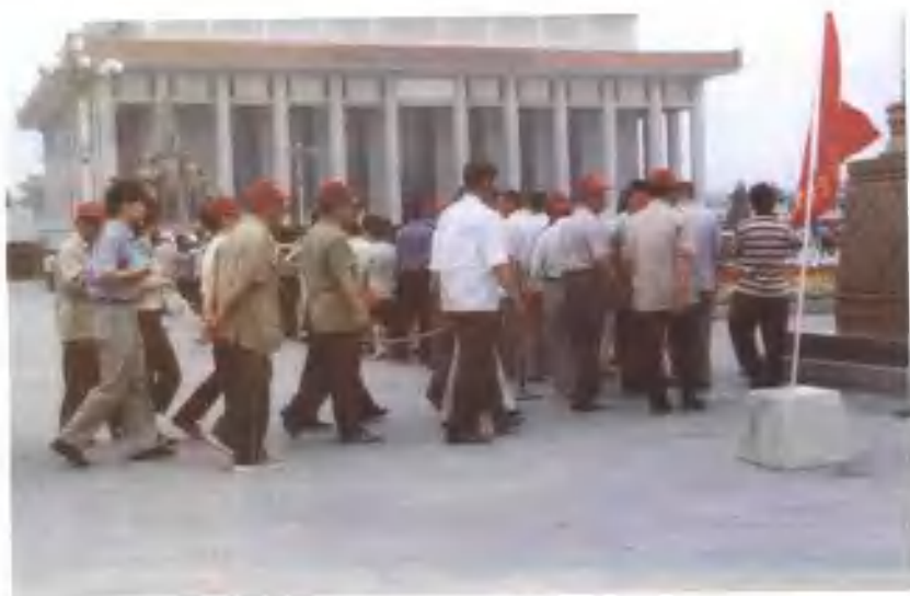
乐亭军休干部到北京瞻仰毛主席遗容。