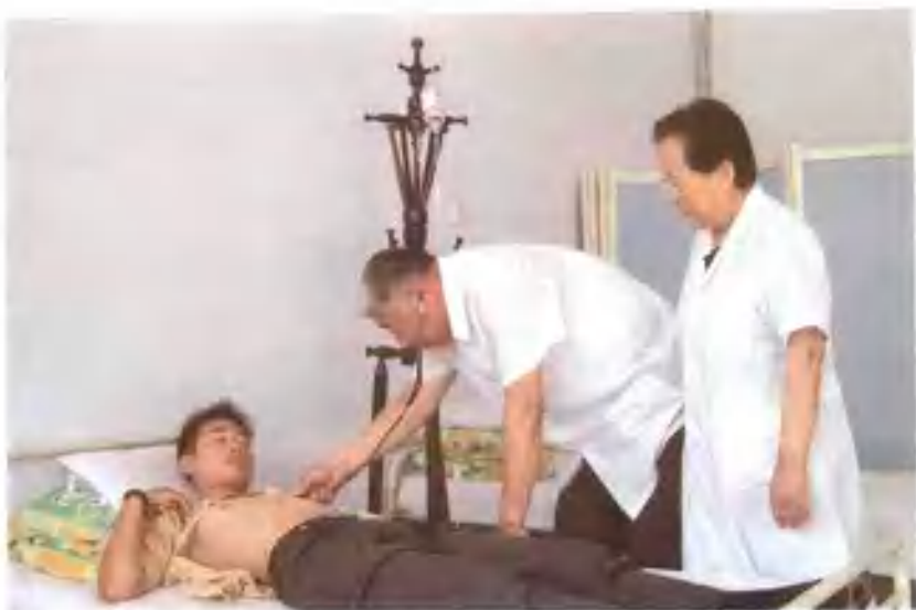
乐亭县军休门诊部的医务人员，义务热情为军休人员和社区居民看病，受到欢迎。