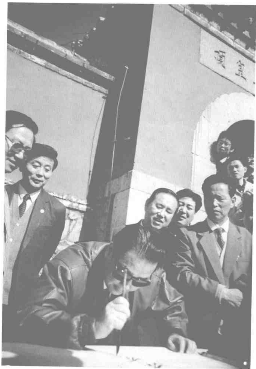
1991年10月31日，中共中央政治局常委、国务院总理李鹏到泰山视察工作。图为李鹏总理在玉皇顶挥毫题词，作者（前右一）跟随采访。