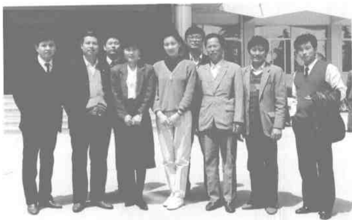
1991年3月下旬，中央电视台新闻播音员李修平来泰山观光旅游。图为泰安电视台的新闻工作者（作者右三）与李修平（右四）等中央台同志合影