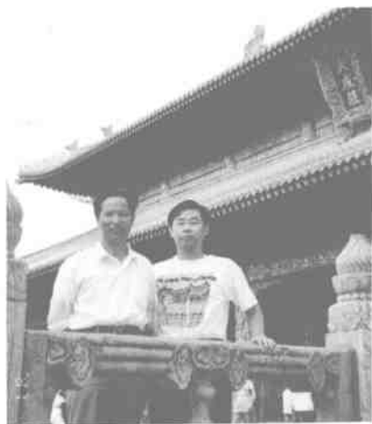
1993年9月17日，作者陪同中央电视台新闻中心主任罗明（现任中央电视台副台长）在曲阜孔庙参观时于大成殿前留影