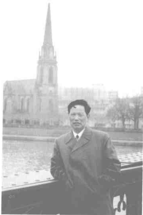
1996年12月6日，作者作为山东省广播电视赴欧洲考察团成员在德国莱茵河畔留影。