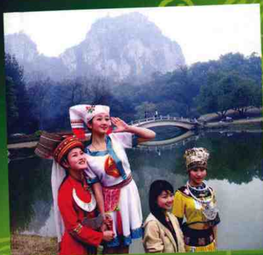
广西山歌擂台赛剪影