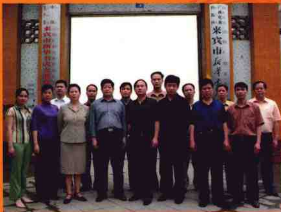
来宾市新华书店领导班子和部分中层干部合影

合山乌金地下藏，百年煤矿美 四化列车响隆隆，能源足够快 头顶高山和大河，煤矿工人风 改革东风吹矿山，扬长避短度