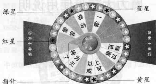
图三 旋转以后的魔力大转盘

步骤： 把魔力大转盘卡片的正面对准书中的魔力大转盘底图——→旋转到四周红、黄、绿、蓝五角空星中分别出现四颗实星，答案便出来了——→从指针开始，按顺时针方向阅读答案，即为“恭喜你获得一百颗星以上可以成为天神了”。