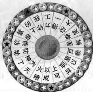
图一 书中的魔力大转盘底图