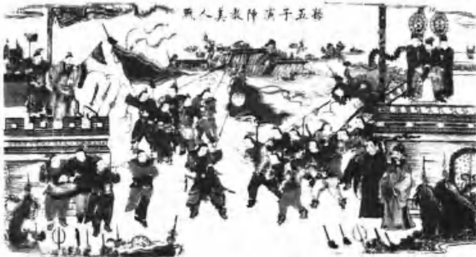
▲年画《孙五（武）子演阵教美人战》