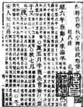
▲清代刊刻的 《春秋左传注疏》书影

夏四月，戊辰，晋侯、宋公、齐国归父、崔天、秦小子憖次于城濮。楚师背鄢而舍，晋侯患之，听舆人之诵，曰：“原田每每，舍其旧而新是谋。”公疑焉。子犯曰：“战也。战而捷，必得诸侯。若其不捷，表里山河，必无害也。”公曰：“若楚惠何？”栾贞子曰：“汉阳诸姬，楚实尽之，思小惠而忘大耻，不如战也。”晋侯梦与楚子搏，楚子伏己而壘其脑，是以惧。子犯曰：“吉。我得天，楚伏其罪，吾且柔之矣。”