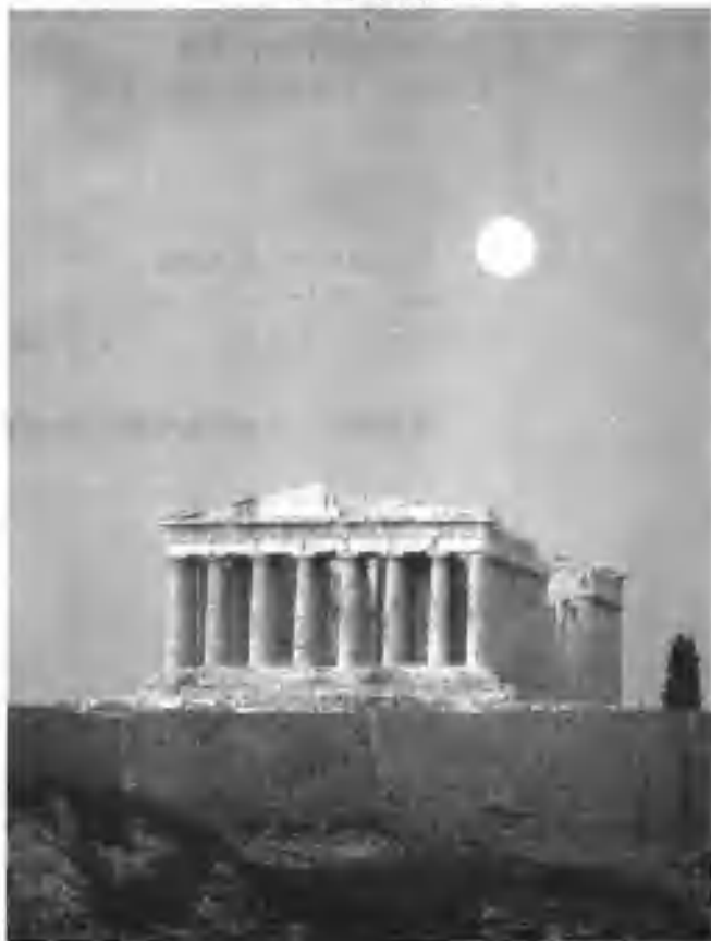
▼古希腊帕提侬神庙

对话的第一部分，是诡辩家、科学家、悲剧家对爱神的颂扬，反映了不同的人所持的不同观点，其中既包括了他们对爱情的认识，也反映了他们的世界观，而不同的叙述方式本身，也是他们观点的注解：诡辩家是