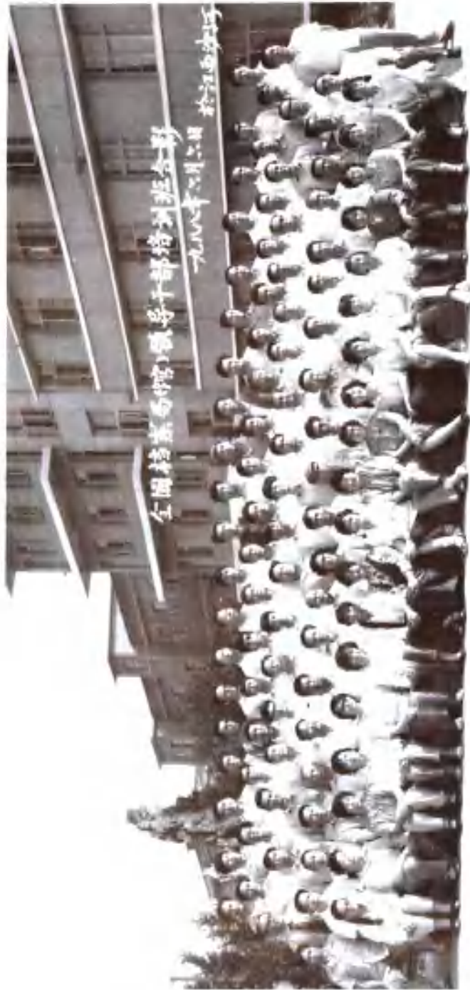
1988年6月6日，全国档案局（馆）领导干部培训班合影，人名索引见（四十一）附3。