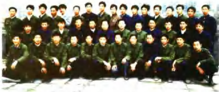
1985年度军转干部合影，人名索引见（三十八）附2。