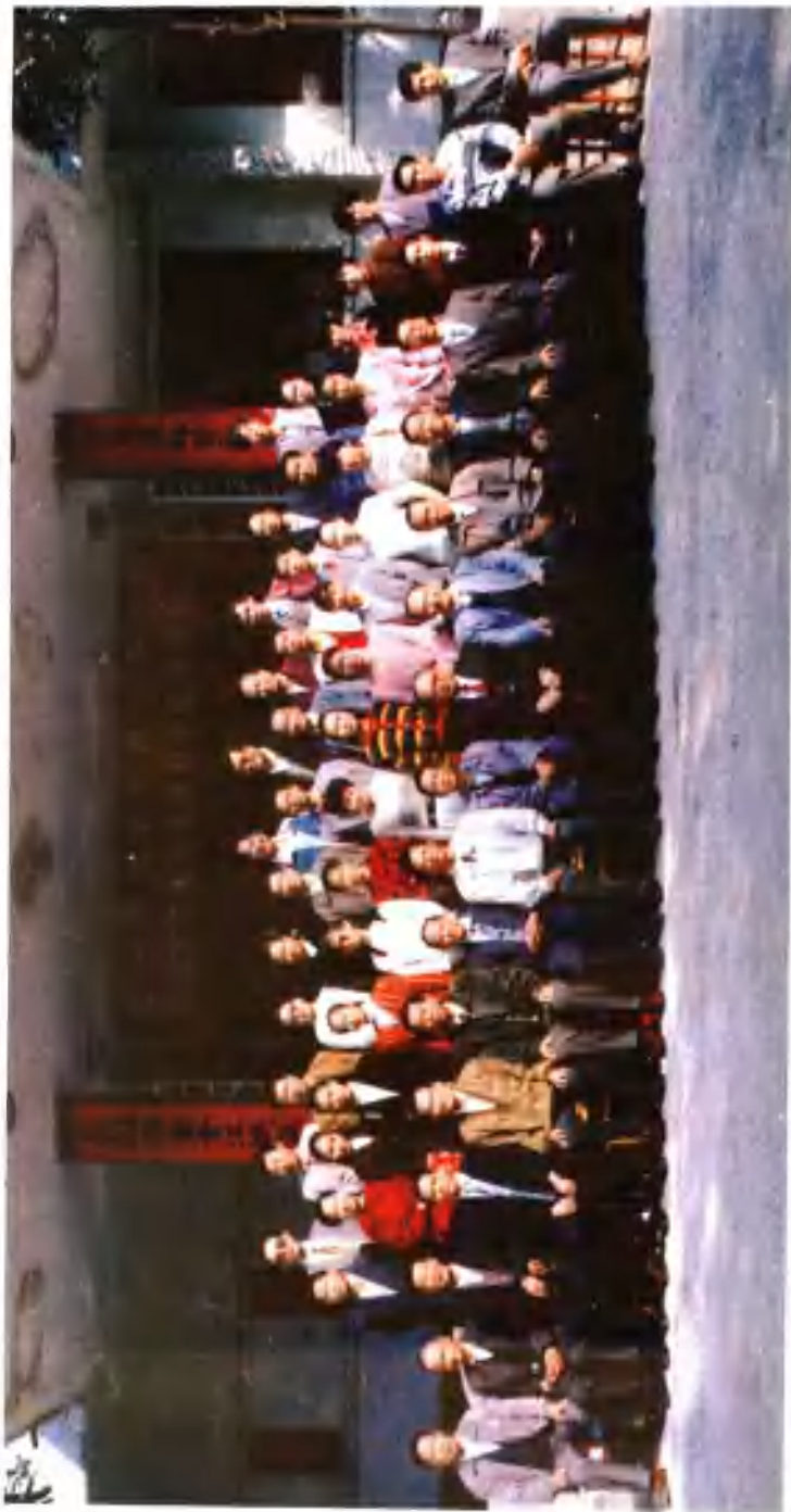
1996年10月28日，省、市领导与档案工作先进单位代表合影。前排左五至十二的领导为：宋大文、刘田喜、陈仲兴、徐景炫、岑道斌、李雪杉、熊同发、阮宝洲。