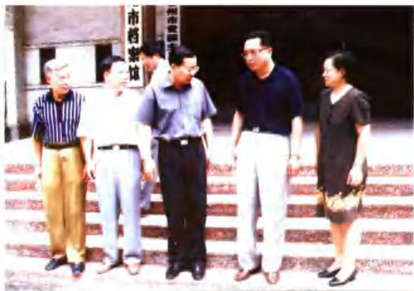
2000年6月，市长汤涛（中）与档案局部分班子成员合影。