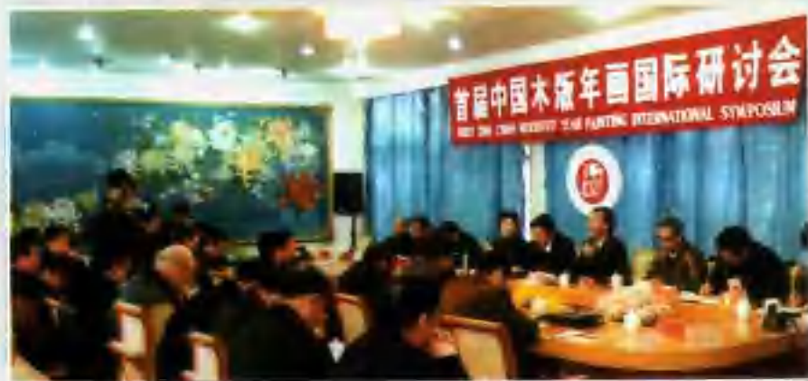
▼ 首届中国木版年画国际研讨会