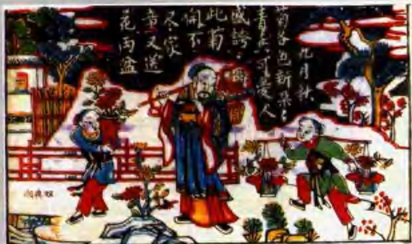
▲ 陶潜爱菊 (武强)