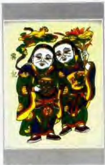
▲ 和合二仙 ▼ 岐山角 ▼ 马上鞭 (开封朱仙镇)