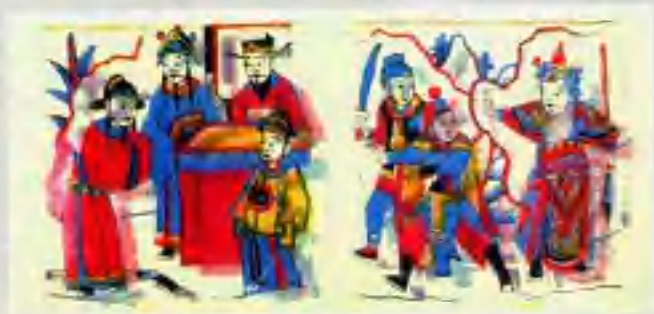
▶ 火攻计 (临汾)