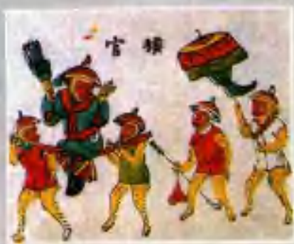
▲ 六顺图 (武强)