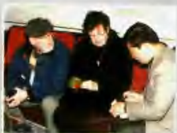
▲ 外国专家接受记者采访