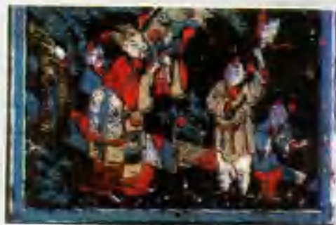
▼ 指日高升 (漳州)