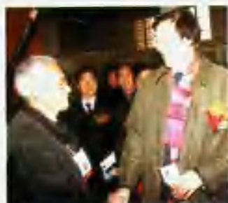
▲ 冯骥才主席与老艺人在一起