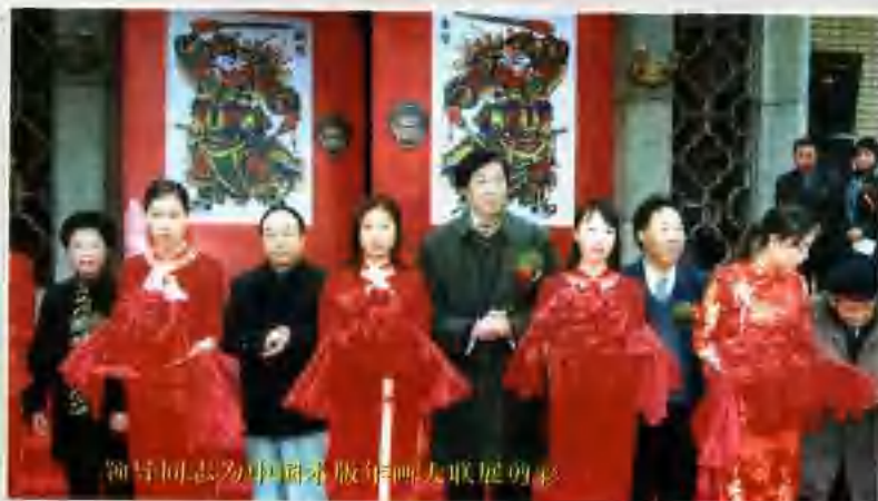
领导同志为河南出版年画友联展的彩