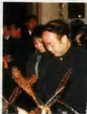
▲ 中共河南省委宣传部、省文联领导同志在博览会上 ▲ 开封市、县领导同志参观年画展